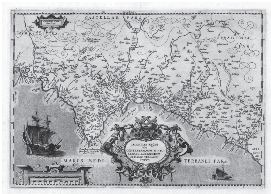
I. A. Oertel: Valentiae Regni Olim... typus, 1584

Valencia, y entre Valencia y Xàtiva. La presencia en el primero de ellos de la ermita de la Concepción de Godella como uno de los centros de referencia geodésica permitió relacionar estos trabajos con el mapa de Oertel, donde también figura a pesar de su escasa relevancia geográfica. Este argumento se reforzaba con el detalle de la diferente latitud asignada a la ciudad de Valencia en los mapas de la Península Ibérica y del Reino de Valencia del Theatrum , y la abundancia de topónimos de la que hace gala este último. 14 La verificación de las operaciones de triangulación mencionadas confirmó esta hipótesis y el estudio del contexto histórico condujo a la presunción de que el objetivo de Muñoz había sido el cálculo astronómico de la latitud de las principales poblaciones valencianas, guiado por intereses militares relacionados con la desconfianza entre cristianos viejos y nuevos que llevaría a la expulsión de los moriscos en 1609. La presencia en el Reino de Valencia del ingeniero Gianbattista Antonelli para planificar las defensas costeras (1561-1562) y del paisajista Anthonie Van den Wijngaerde (1563) parecía responder a este mismo propósito, al igual que la orden emitida por el virrey Vespasiano Gonzaga en 1575 para que se hiciese un reconocimiento del litoral con el fin de averiguar sus puntos vulnerables. La identificación en el mapa de Oertel de varios lugares de poblamiento morisco sirvió para reforzar esta idea. 15