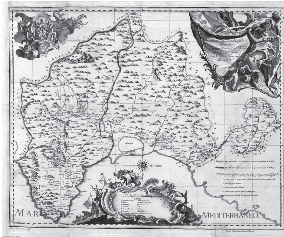
IV. T. Vilanova: Mapa del Arzobispado de Valencia, 1761

cartada, pues, esta posibilidad, ¿qué sabemos actualmente sobre el origen y la autoría de este mapa?