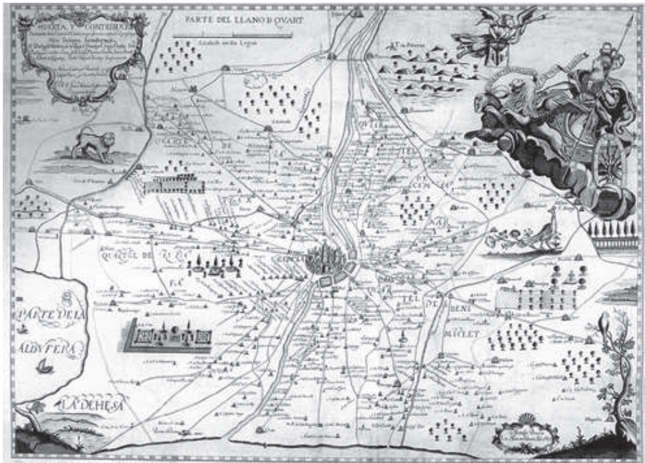
III. F. A. Cassaus: Huerta, y contribución Particular de la Ciudad de Valencia, 1695

de la huerta de Valencia contrasta vivamente con el desinterés de Cassaus hacia la representación del paisaje y con los aspectos simbólicos que convierten al plano en un auténtico conjunto teatral al servicio de la iconografía cristiana.