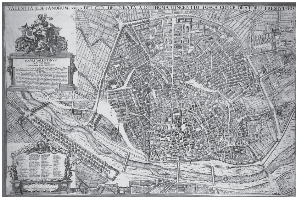
VII. T. V. Tosca: Valentia Edetanorum vulgo del Cid..., ca. 1738

punto lógica, ya que Bordázar no sólo era discípulo de Tosca y debió tener acceso al original manuscrito, sino que ambos mantenían una franca amistad. Fue Bordázar quien, por ejemplo, le sugirió a Tosca la redacción del Compendio Mathematico (1707-1715), una obra capital que acabaría imprimiendo en su taller. Según se desprende de una carta dirigida al marqués de la Compuesta en 1735, Bordázar acometió la renovación del plano desde la admiración y como homenaje a su maestro. Lo hizo, no obstante, con la pretensión declarada de que le sirviera como mérito a la hora de ser nombrado director de la academia matemática que tenía en proyecto. 70 Con este fin, inició las operaciones en compañía del grabador Cristóbal Belda, esperando que el consistorio municipal les concediera más tarde una ayuda para cubrir los gastos. En enero de 1736 presentaron un memorial ante él en el que afirmaban tener trabajada ya la zona comprendida entre el Grau y Russafa y pedían una gratificación de 160 libras valencianas. El pleno les adelantó cien de ellas y dejó pendiente el resto hasta la entrega de este plano y del correspondiente a la particular contribución, condición que debía cumplirse en el plazo de un año.