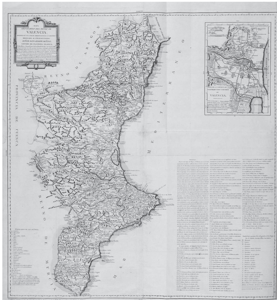
II. T. López: Mapa Geográfico del Reyno de Valencia, 1788

1698), Charles Inselin ( Carte du Royaume de Valence , 1706), Charles Desnay (una carta que continúa inédita) y los mapas del arzobispado de Valencia (1761) y del obispado de Segorbe (1773) de los que más tarde hablaremos. Estamos, por tanto, ante un autor y una obra aparentemente cristalinosa.