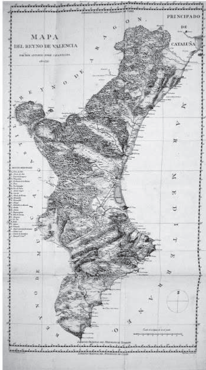
VIII. A. J. Cavanilles: Mapa del Reyno de Valencia, 1795-1797