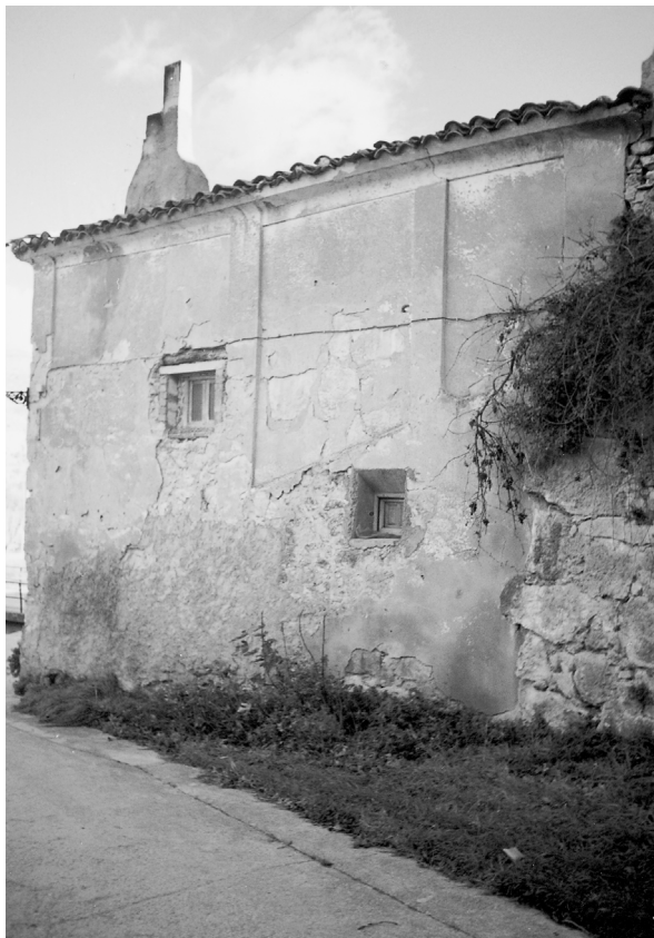
Foto 1. Molino de Casas Altas.