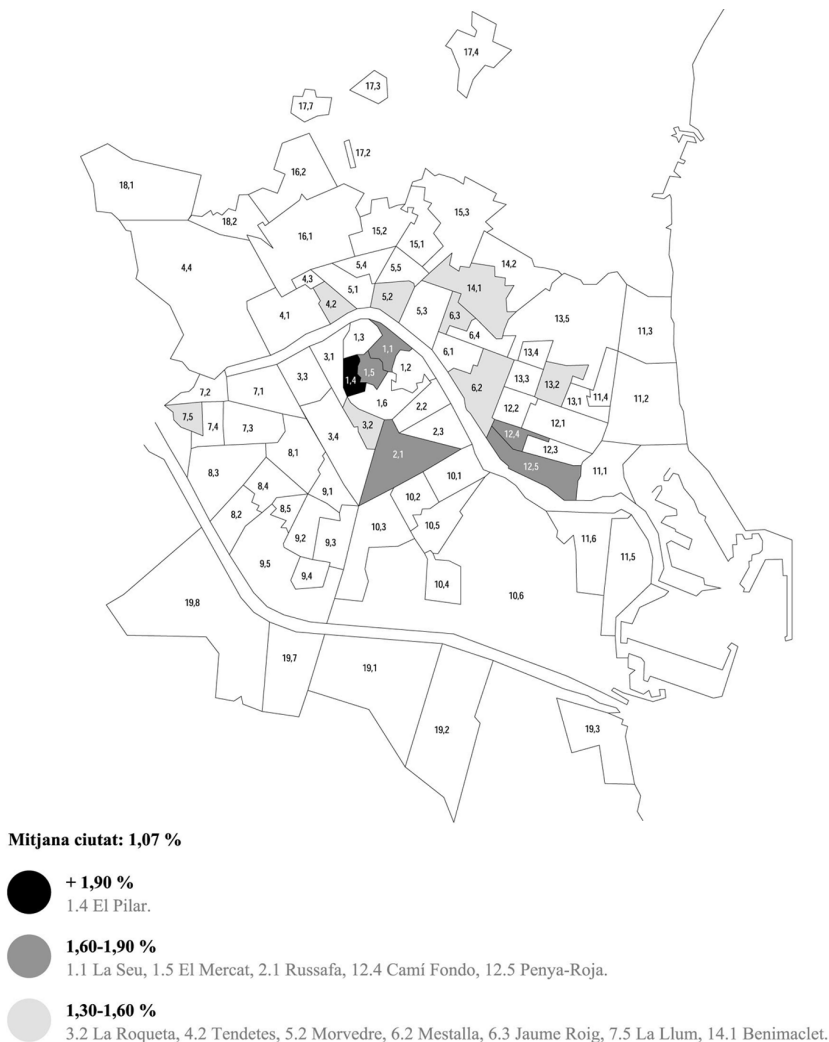
Mapa 1. Barris de València amb major proporció de veïns immigrants. Any 1998.

toriana). Per això es considera que els fulls padronals constitueixen una bona aproximació a aspectes bàsics de la inserció residencial dels immigrants.