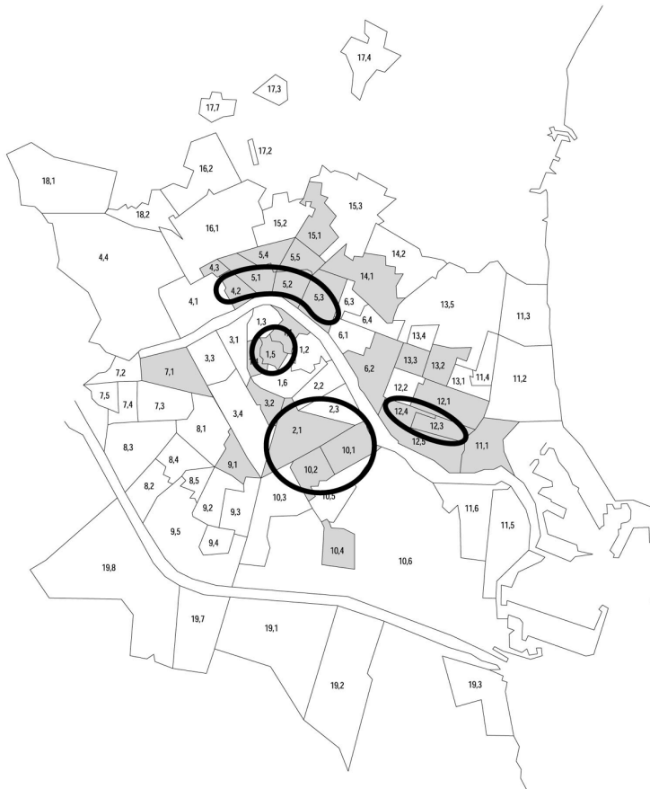
Mapa 3. Possibles "espais d'immigració" de la ciutat de València.

determinants punts del teixit urbà del barri 13 . Àdhuc en els barris amb una major presència d'immigrants es dona una barreja de residents immigrants i autòctons, que comparteixen els mateixos carrers i finques, si bé amb un nombre relativament major dels primers als habitatges més modestos o de menor atractiu. A València es dona una situació de convivència residencial, una barreja d'habitatge immigrant i natiu relativament ampla i extensa.