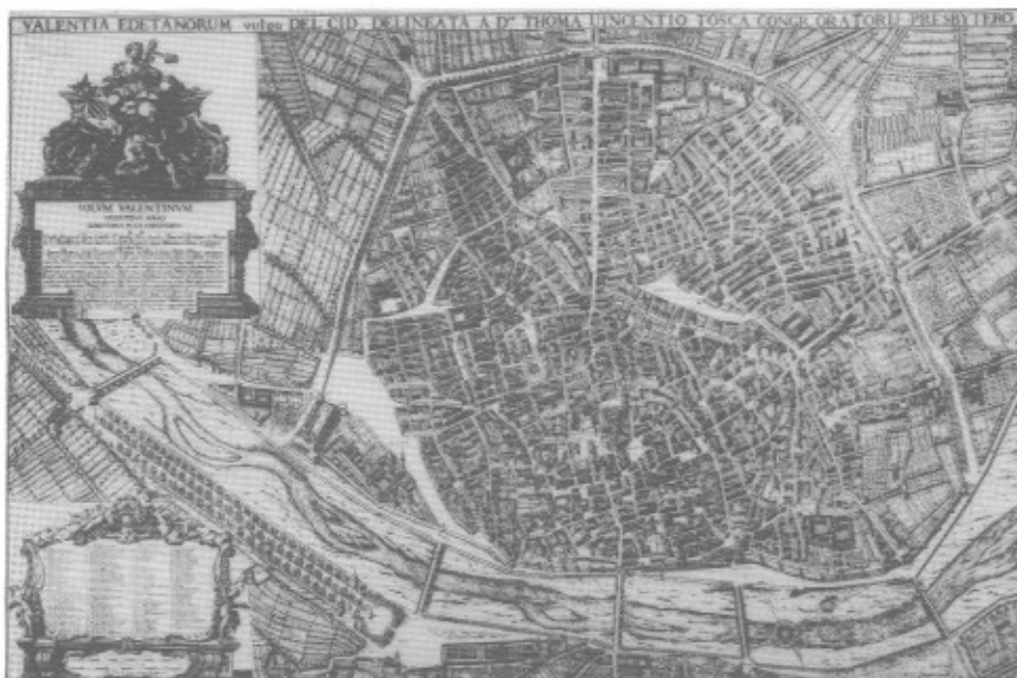
Fig. 2.—Plano de la ciudad de València grabado por José Fortea, probablemente a partir de las modificaciones efectuadas por Antonio Bordázar sobre el original de Tomás Vicente Tosca hacia 1736 (BUV).