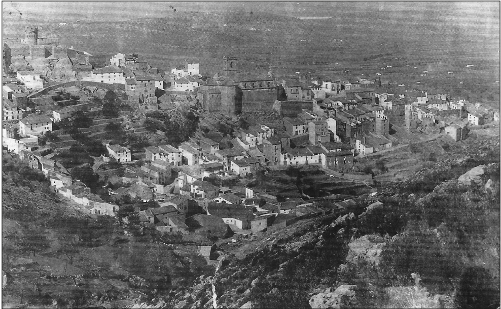
Figura 1. Vilafamés ca. 1920, vista de la vila des del tossal de la Font (SE).

camp visual del territori i alhora el control dels diferents accessos al Pla que s'ubica al nord de la localitat. Per la banda sud controla el corredor de Sant Joan de Moró, per l'oest l'estret que comunica amb la rambla de la Viuda, mentre a l'est i nord el control s'estén sobre la principal via de comunicació des de temps antics, la via Augusta.