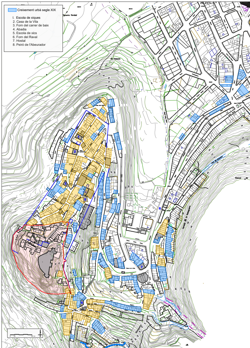
Figura 4. Creixement urbà de la vila al segle XIX.

L'any 1863 es redactà el “Proyecto de rectificación y reparación de la subida al pueblo de Villafamés desde la Cruz [peiró de l'Abeurador] hasta el Portal” per part del director de camins veïnals Luis Alfonso 19 .