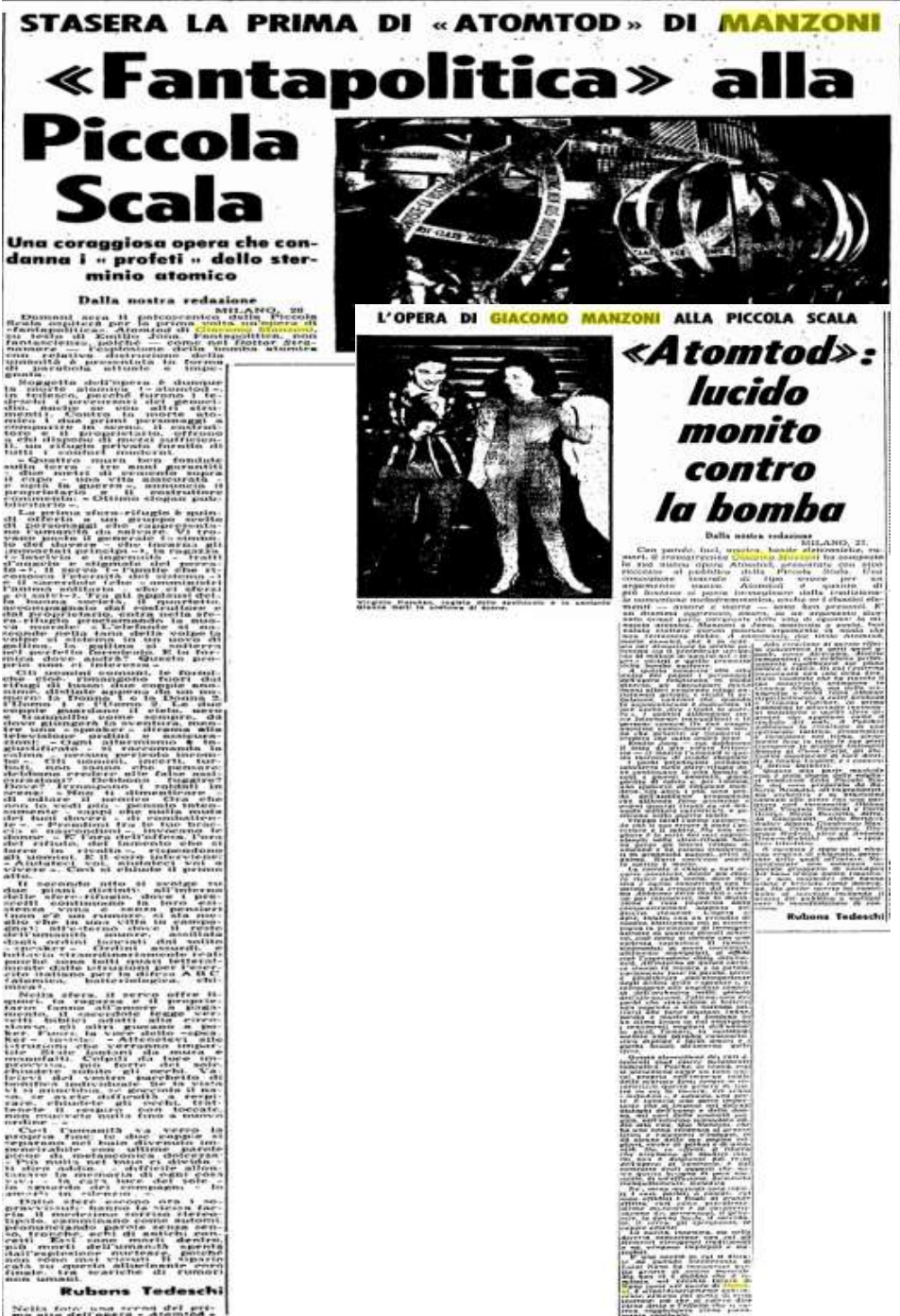
L'Unità, 27 et 28 mars 1965 : critiques d'Atomtod de Rubens Tedeschi