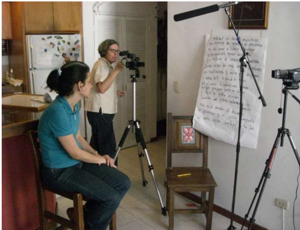
Imagen 7. Grabaciones para mi ópera electrónica Toledana , 2009

Me encanta el trabajo colectivo con otros artistas. Realicé una ópera-video con mis amigas más cercanas: Toledana 5 .