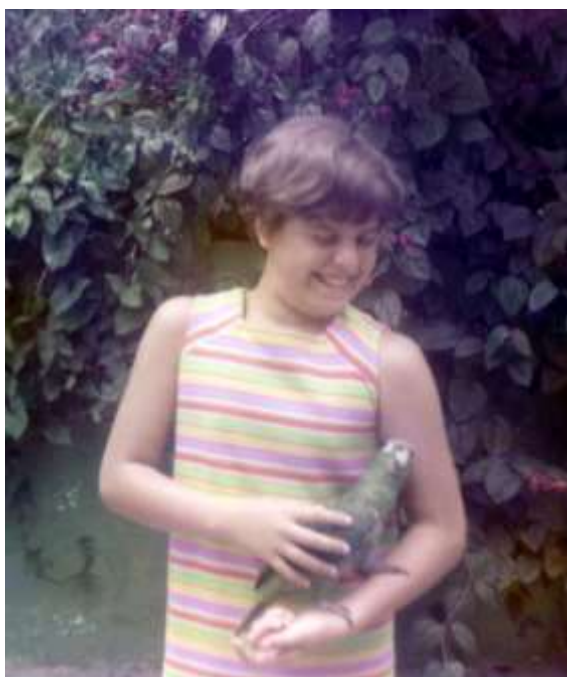
Imagen 3. Yo con Loro desde pequeña, c. 1967