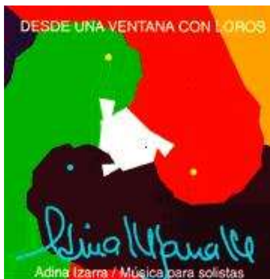
Imagen 4. Carátula de mi cd DESDE UNA VENTANA CON LOROS, 1993