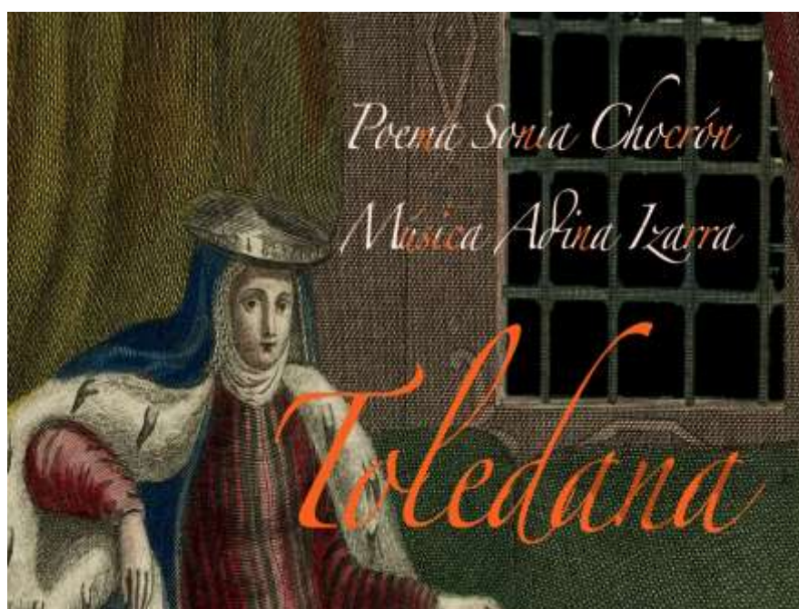
Imagen 8. Carátula de Toledana , 2009

y he participado en trabajos de este género en Sistema Poliedro 6 , Proyecto NorteSouth 7 , y con la Fundación Telefónica de Venezuela 8 .