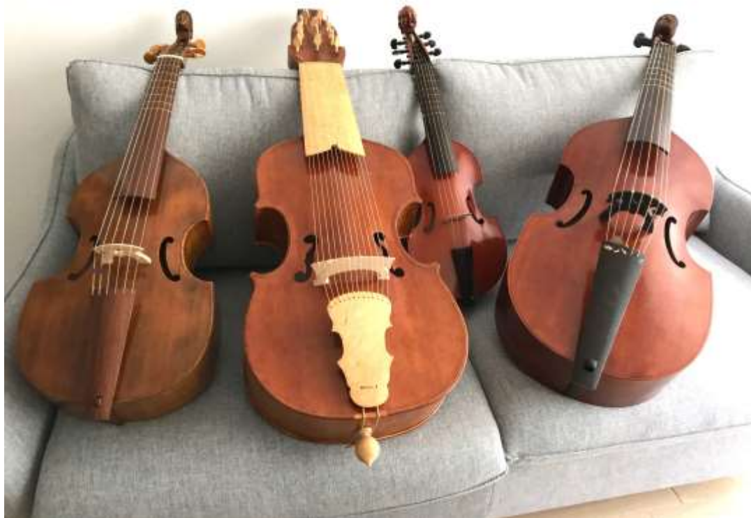
Violes de gambes

Il ne pouvait que susciter, tant sur le plan visuel que sur le plan sonore, des associations complices. Un quatuor de violes de gambes de différentes tailles, aux têtes humaines ou animales sculptées, aux chevalets et rosaces subtilement dessinés, aux touches et cordiers parfois précieusement incrustés, viendront enrichir une palette de gestes et de sonorités un temps masquée par l'absolue nécessité des avancées et recherches musicales. En s'emparant ponctuellement de l'oud, la théorbiste, se jouant des démarcations, pourra nourrir une conversation fertile entre Orient et Occident.