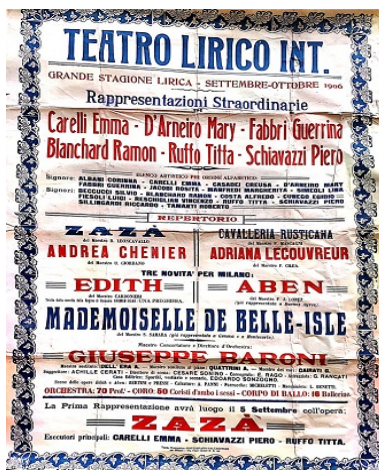
Afiche de la presentación de Aben en Milán, 1906

El 6 de octubre de 1906 esta ópera se representó en el Teatro Lírico de la ciudad de Milán 38 . López Salgueiro viajó a Italia para esta presentación. Algunas críticas fueron muy favorables y otras opinaron que el “argumento estuvo absolutamente carente de vitalidad: en conclusión, resultado negativo” 39 .