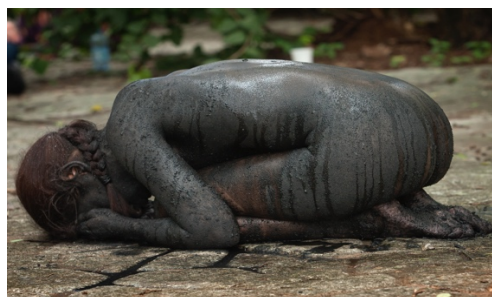
Fig. 6. Piedra (2013) Vídeo Víctor Bautista, Henry Castillo, fotografía de Julio Pantoja y Merlene Ramírez-Cancio

Las obras Piedra (2013) [Fig. 6] y Tierra (2013) [Fig. 7] son dos performances de carácter ecofeminista que exploran la relación entre el cuerpo femenino y la naturaleza, utilizando elementos simbólicos. En ambas obras, el cuerpo individual de la artista actúa como un medio para explorar la relación entre la fragilidad humana desde la metáfora de la tierra. El cuerpo se convierte en un vehículo para transmitir una experiencia visceral de conexión con el mundo natural, al tiempo que subraya la vulnerabilidad y la transitoriedad de la existencia humana como mujer, cuando alguien orina sobre el cuerpo-piedra. Una brutal agresión que narra la historia del patriarcado sobre las mujeres y sobre el propio planeta.