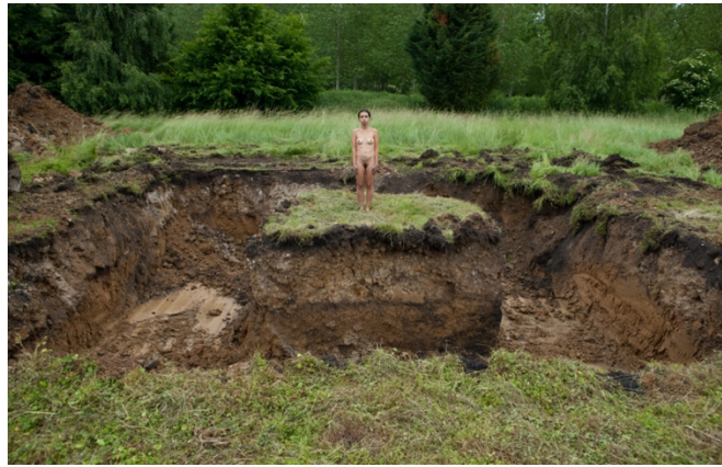
Fig. 7. Tierra (2013) Acción. Cámara y fotografía Bertrand Huet y Didier Martial

En 2016, la artista realiza las performances tituladas La intención [Fig. 8]; Ascención [Fig. 9]; y La siesta [Fig. 10]. En La siesta , Regina cae sobre un colchón bajo un sueño profundo después de tomar diez ml. de un medicamento hipnótico utilizado comúnmente para realizar violaciones silenciosas. Dos hombres le despiertan violentamente tirándole a la cara una cubeta de agua fría.