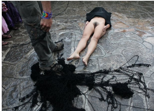
Fig. 5. Hilo en el Tiempo (2012) Acción.

La obra Hilo en el Tiempo (2012) [Fig. 5] se caracteriza por su enfoque conceptual y su uso de estrategias estéticas que provocan reflexiones sobre la temporalidad y la fragilidad del cuerpo humano. En esta obra, la artista emplea la metáfora del hilo para representar la continuidad del tiempo y la conexión entre el pasado, el presente y el futuro. A través de su acción de desenrollar y enrollar un hilo en su cuerpo, Galindo crea una imagen visualmente impactante que invita al espectador a contemplar la fugacidad y la persistencia de la vida humana. La simplicidad de la acción contrasta con la profundidad de su significado, invitando a una reflexión sobre la naturaleza efímera de la existencia.