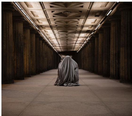
Fig. 14. Aparición (2022)

Por ello, sus últimas obras se han visto modificadas a partir del concepto de performance colectiva como cuerpo político y social. En 2022 realiza en España su performance titulada Aparición [Fig. 14]. Se trata de una colaboración de cuarenta y tres mujeres cubiertas que aparecen en el espacio público. Una cantidad que corresponde al número de mujeres asesinadas en España en el año 2021. La performance también se realiza en Alemania: