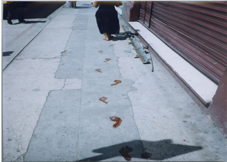
Fig. 1. ¿Quién puede borrar las huellas? (2003) Fotografía Víctor Pérez. Vídeo Damilo Montenegro

Por ejemplo, en su obra ¿Quién puede borrar las huellas? (2003) [Fig. 1], Galindo se arrastra descalza por las calles de Ciudad de Guatemala, dejando un rastro de sangre que simboliza las huellas indelebles de la violencia en la sociedad guatemalteca. Esta performance, como muchas otras de Galindo, provoca una reflexión profunda sobre la vulnerabilidad del cuerpo humano y la urgencia de la acción social y política para combatir la injusticia.