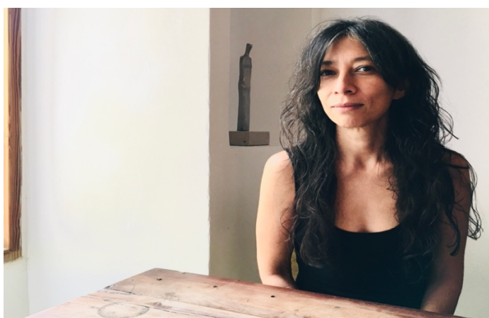
Fig. 0.1. Retrato de la artista Regina José Galindo

El presente texto Arte, feminismo y cuerpo político , presenta una investigación acerca de la obra de la artista Regina José Galindo (Guatemala, 27 agosto 1974) [Fig.0.1]. Como objetivo general, nuestro análisis pretende contribuir a los estudios de la performance en Latinoamérica. En concreto, nuestro objetivo es relacionar los conceptos de arte, feminismo y cuerpo político a través de las estrategias de lucha activista en la performance de esta artista. Más preciosamente, queremos llamar la atención sobre esta mujer artista y situarla en nuestro punto de mira como una mujer luchadora y activista que nos ofrece la posibilidad de trascender el significado del arte para impregnarse en lo social. En este sentido, el recorrido de nuestro foco de atención está jalonado por catorce obras de Regina José Galindo, realizadas en un período de veintitrés años, entre 1999 y 2022.