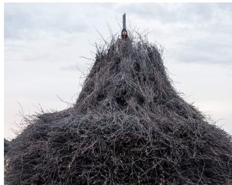
Fig. 8. La intención (2016) Fotografía Annamaria La Mastra

En 2016, la artista realiza las performances tituladas La intención [Fig. 8]; Ascención [Fig. 9]; y La siesta [Fig. 10]. En La siesta , Regina cae sobre un colchón bajo un sueño profundo después de tomar diez ml. de un medicamento hipnótico utilizado comúnmente para realizar violaciones silenciosas. Dos hombres le despiertan violentamente tirándole a la cara una cubeta de agua fría.