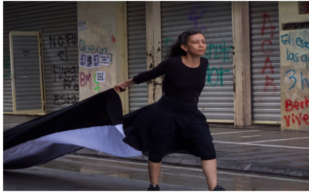
Figs. 3.1. a 3.11. Guatemala Feminicida (2021) Performance.

En la mayoría de las obras seleccionadas para esta investigación, la artista se presenta a sí misma sola, ante la mirada del público, llamando la atención sobre nuestra ética como personas observantes de diversas atrocidades y/o metáforas visuales. En concreto, presenciamos una suerte de rapsodia visual en la que el retrato de la artista va desde el cuerpo yacente de una mujer blanca, pasando por el cuerpo negro y racializado de una mujer-piedra, a la metáfora del cuerpo-tierra de una mujer-naturaleza. Y en esta composición instrumental, nos encontramos con la alusión a la mujer-víctima; a la mujer-violada; a la mujer-superviviente; a la mujer-heroína; y a la mujer-bandera, portadora de la esperanza. Según la periodista Lola Fernández (2017), “la artista se mete en la piel de las mujeres asesinadas en Guatemala”, y esta es precisamente su manera de transmitir empatía, la cual le conduce a crear un cuerpo político como vehículo de lucha feminista y transformación social. Se trata pues de un cuerpo colectivo y político, en la medida en que se identifica socialmente con un sector muy amplio de la población.