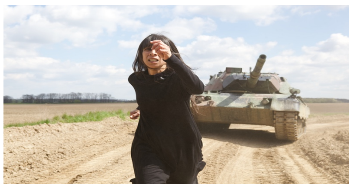
Fig. 11. La sombra (2017) Cámara, sonido y edición Nicolas Rösener, segunda cámara Gabriel Caballeros, Curaduría Monika Szewcyk, Producción Leon Hösl y Fotografía Michael Nast

En La sombra [Fig. 11] es una performance realizada en 2017, donde un tanque alemán LEOPARD de la segunda guerra mundial persigue a la artista en un círculo, sin principio ni fin. El cuerpo de la mujer es el objetivo de esta guerra circular, de la que no se puede escapar.