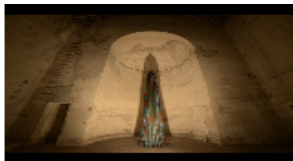
Fig. 9. La Ascensión (2016)