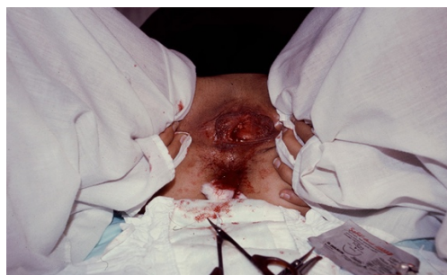
Fig. 4. Himenoplastia (2004) Fotografía Belia de Vico. Video Aníbal López

Regina José Galindo recibió el Premio León de Oro a la mejor artista joven en la 51 a Bienal de Venecia (2005) por su trabajo ¿Quién puede borrar las huellas? (2003) e Himenoplastia (2004) [Fig. 4], dos piezas cruciales que critican la violencia guatemalteca proveniente de conceptos erróneos de la moral. En 2011 recibió también el Premio Príncipe Claus de los Países Bajos por su capacidad para transformar la injusticia y la indignación en actos públicos que exigen respuesta.