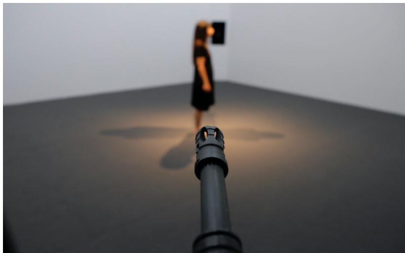
Fig. 12. El objetivo (2017) Cámara Nicolas Rösener, Edición Pepe Orozco, Curaduría Monika Szewczyk y Producción Leon Hösl

artista permanece dentro de una habitación y el público solo puede verla a través de la mira de cuatro fusiles alemanes G-36, ubicados en cuatro costados.