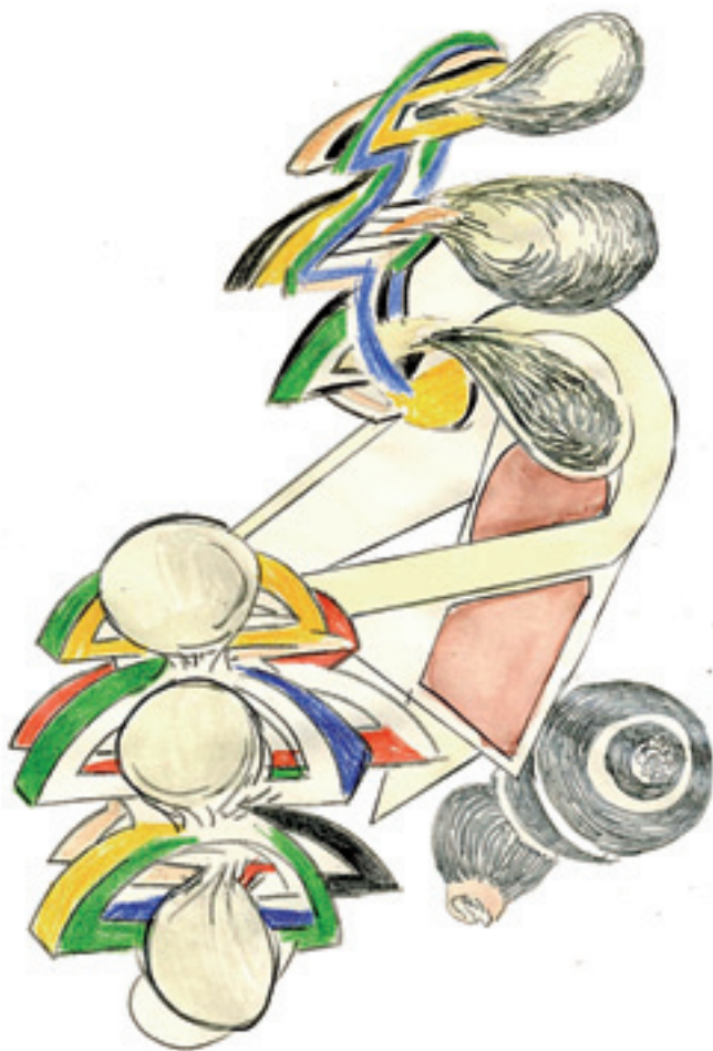
Julio López Tornel. Sense títol (tríptic, fragment), 2012. Tècnica mixta sobre paper, 29,7 x 42 cm.

«S'ENTENIA QUE LA FORMA AMB QUÈ ES REGENERAVA EL PÒLIP CERTIFICAVA QUE LA MATÈRIA ERA UNA ENTITAT DINÀMICA I NO SOLAMENT PASSIVA»