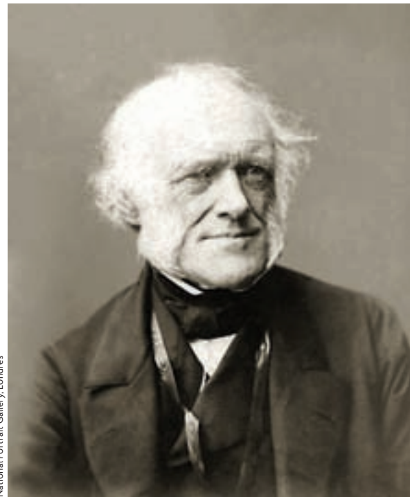
National Portrait Gallery, Londres

«HOY EN DÍA, LA CIENCIA GOZA DE UN PRESTIGIO QUE PARECE PERMANENTE, PERO SU SIGNIFICADO VARÍA CON EL TIEMPO, ADEMÁS DE CON EL TERRITORIO DONDE SE UBIQUE»