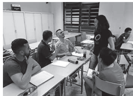
Fig. 1. Imatges en que es mostra la fase de formació i sensibilització del projecte.