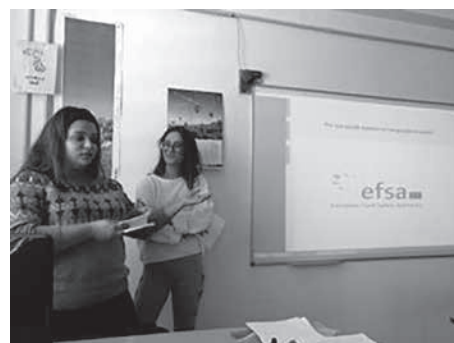
Fig. 2. Imatges de les exposicions de les investigacions dutes a terme pels alumnes.