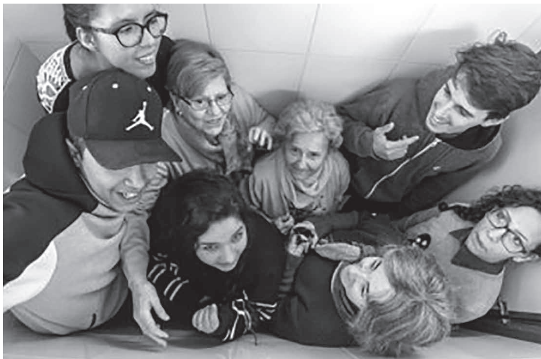
Fig. 6. En el projecte coexisteixen diverses generacions, donant al projecte un caire intergeneracional.