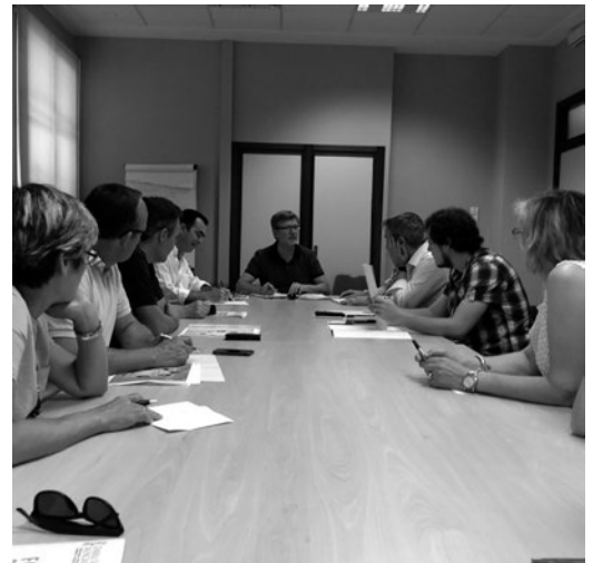
Reunió Alcaldes i tècnics del Consorci FPA en la Conselleria d'Educació