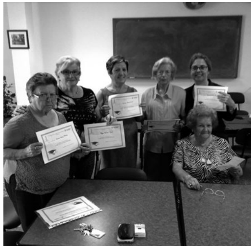
Taller de Memòria en Teresa