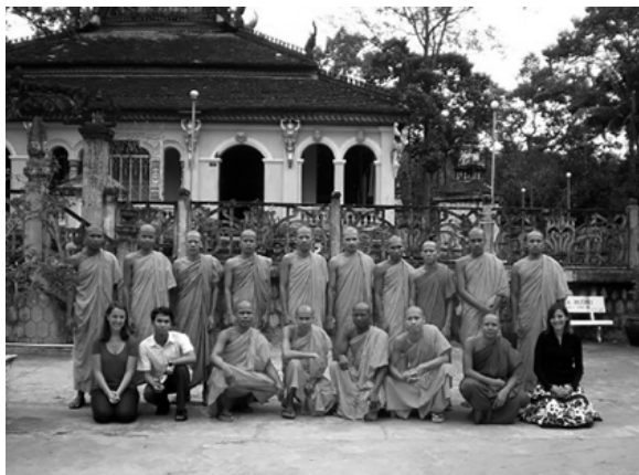
Imatge 2. Acció Educativa 3: Reunió amb tots els monjos budistes Khmer Krom que van passar a formar també part dels docents a la universitat en el Grau de Llengua i Cultura Khmer a la universitat

Per últim, durant molts mesos de negociacions amb diferents estaments polítics a nivell provincial i nacional, es va aconseguir la implementació del Grau universitari en Llengua i Cultura Khmer, impartit a la TVU tant per monjos budistes com a professors sense estudis reglats locals. Aquest fet, es va considerar un èxit històric per part de tota la comunitat Khmer Krom, i no tan sols a la província de Trà Vinh, sinó per tot arreu perquè fins eixe instant, l'accés a la llengua i cultura khmer s'accedia exclusivament per part de les pagodes Thevades i únicament per a públic masculí. Llavors, es va aconseguir obrir les portes a tothom amb uns estudis oficials.