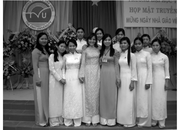
Imatge 3. Fotografia de la graduació de les estudiantetes Khmer Krom: les dues en blau son les estudiantetes de Formació Professional que van superar les proves de administració i les altres nou son les graduades al Grau d'Estudis Anglesos.

Ara mateix, al curs 2021-2022, d'aquestes primeres nou estudiantetes que van finalitzar els estudis, en plena pandèmia mundial tan sols he pogut contactar amb set d'elles: una de elles està a l'atur a Itàlia; una altra viu amb la seua parella xilena a Santiago de Xile i tampoc té treball; una altra viu a Austràlia