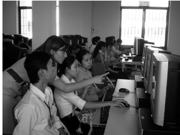
Imatge 1. Acció Educativa 1: Disseny plurilingüe de la pàgina web de Trà Vinh University

Al llarg d'un curs acadèmic, les estudiants universitàries Khmer Krom van ser les encarregades de dur a terme el disseny de la pàgina web de la universitat, tant en anglès com en la seua pròpia llengua materna, pel que van rebre classes de informàtica, programació i anglès (nivell B2). Aquest projecte va ser compartit entre tot el personal universitari (estudiants, PAS i PDI) amb la finalitat d'estrènyer les relacions entre ells mateixes i d'alimentar el sentiment de pertinença i camaderia entre tots i totes les agents implicats.