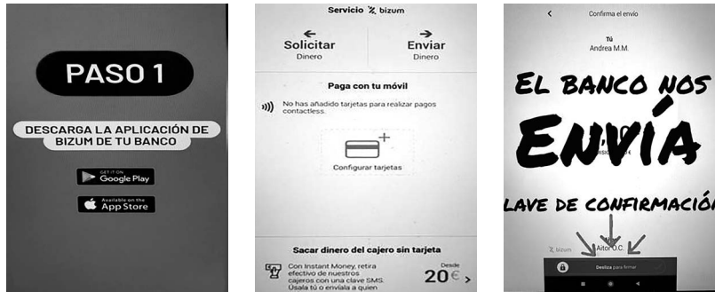
Imatge 1. Píndola formativa amb les etapes a seguir a Bizum