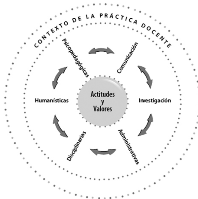
Figura 1. Modelo de competencias del profesor de medicina Tomado de (Martínez et al, 2008)

Como puede observarse en la figura 1, se establecieron seis tipos de competencias: disciplinarias, humanísticas, psicopedagógicas, comunicación, investigación y administrativas, así como un conjunto común de actitudes y valores, que, como se señaló anteriormente, se relacionan entre sí y se ponen en operación en los diversos contextos donde se desarrolla la práctica docente del profesor de medicina. Cada una de las competencias se desglosa en el modelo mediante la descripción de una serie de actividades o funciones.