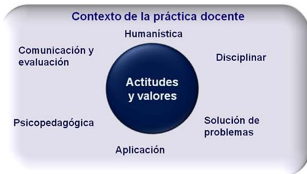
Figura 3. Modelo de Competencias Docentes del Profesor de Medicina

Este nuevo modelo es congruente con la transición al Plan de Estudios de la Facultad de Medicina (2010), donde en términos de evaluación docente se señala que: “Para evaluar el desempeño docente se deben utilizar distintas estrategias complementarias entre las que destacan: evaluación de los docentes mediante la opinión de los estudiantes , por competencias , por logros del aprendizaje de los estudiantes y por autoevaluación , entre otras.” Pretendemos promover a corto plazo el desarrollo de otra línea de investigación que implica el uso de los resultados asociados a cada competencia como predictores del desempeño académico de los estudiantes.