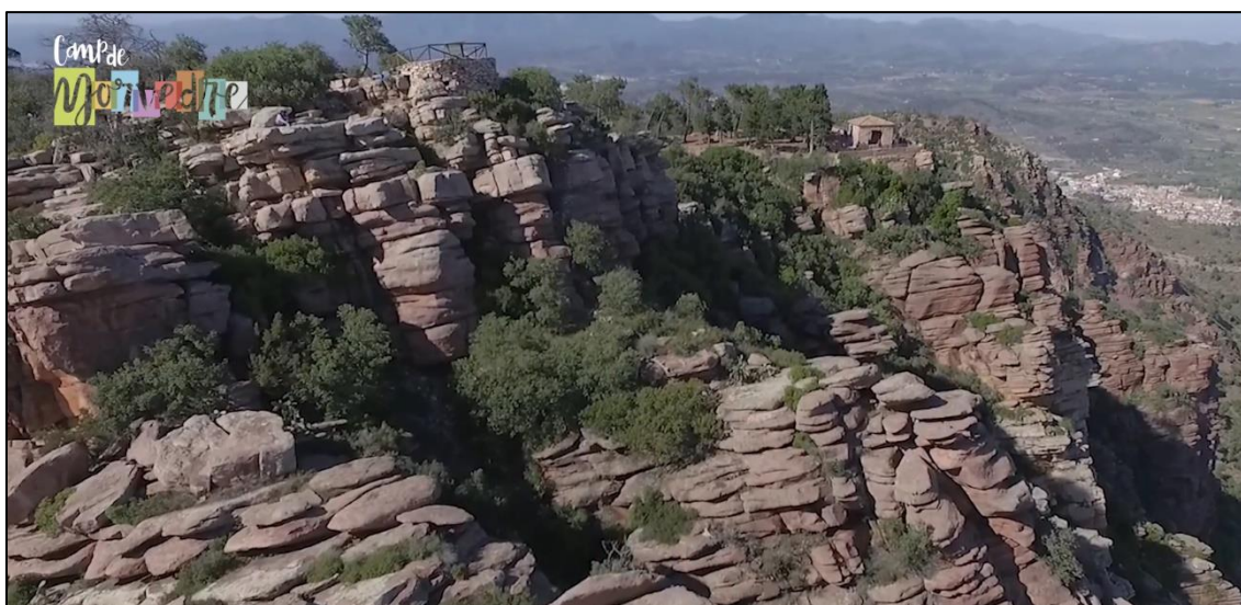
Figura 4. Vista aérea del mirador del Garbí