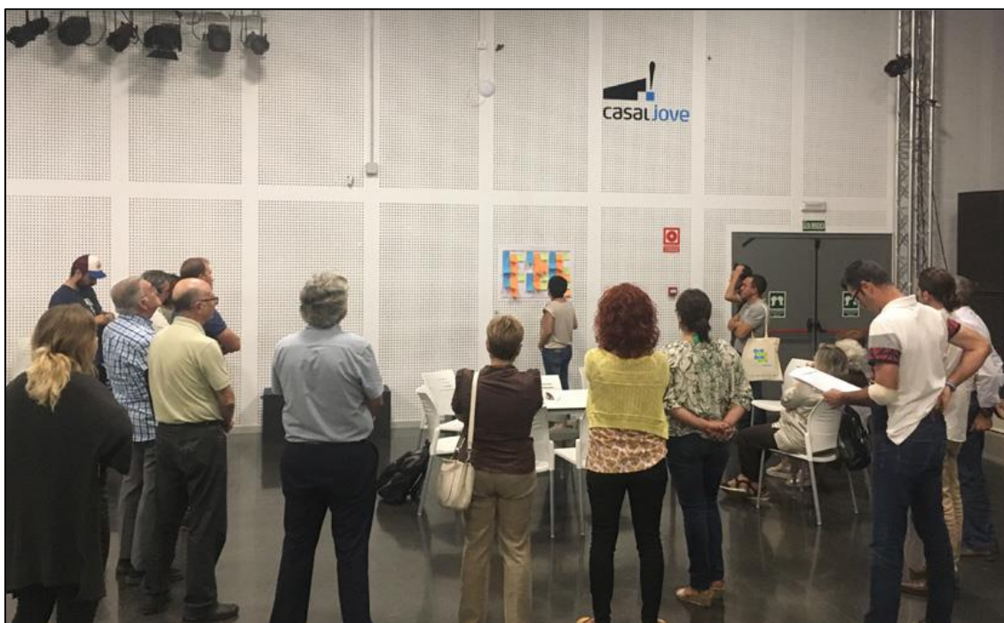
Figura 1. Taller de trabajo de Impulso de la mesa comarcal de turismo

Fuente: Ayuntamiento de Sagunto. Septiembre de 2018. Casal Jove Puerto de Sagunto.