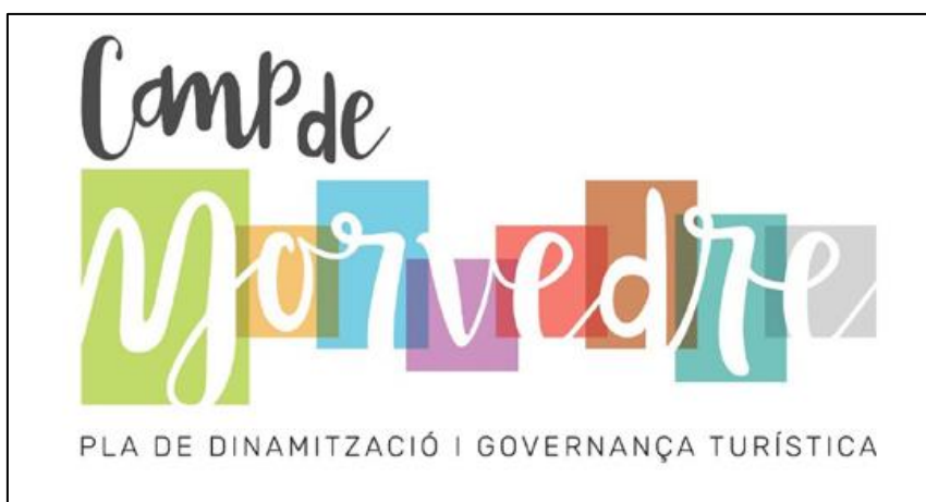
Figura 2. Logo del Plan de Gobernanza y Dinamización Turística del Camp de Morvedre