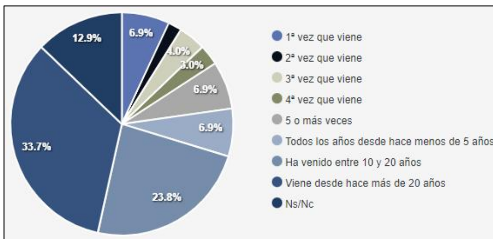
Figura 2. Veces que se ha visitado Cullera. Perfil del turista según el número de veces que ha visitado Cullera