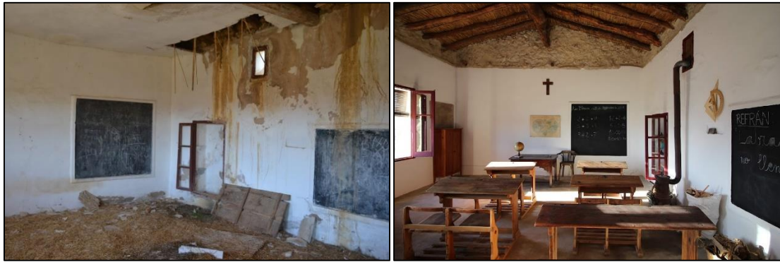
Figura 1. Escuela de Mas Blanco: antes y después de su rehabilitación