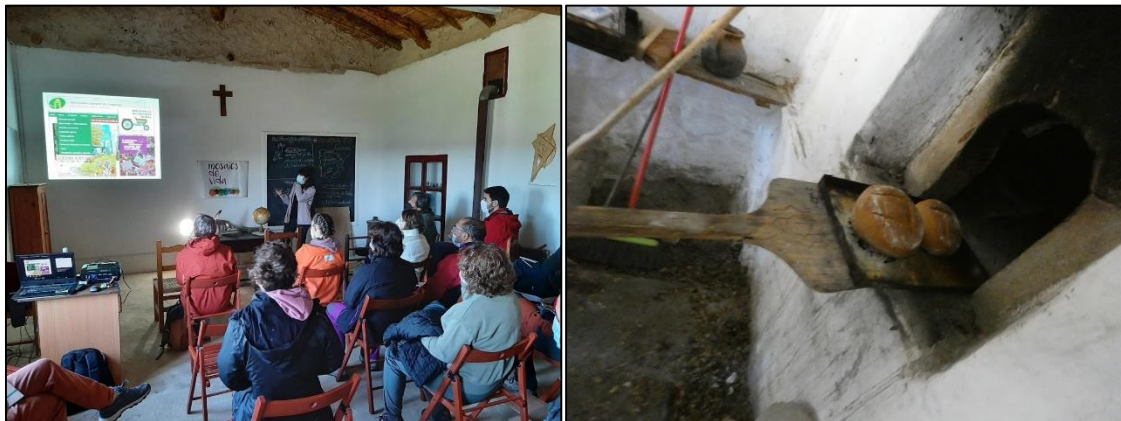
Figura 3. Seminario en la escuela de Mas Blanco y horneada en el horno communal. Edificios rehabilitados y actividades organizadas por Recartografías