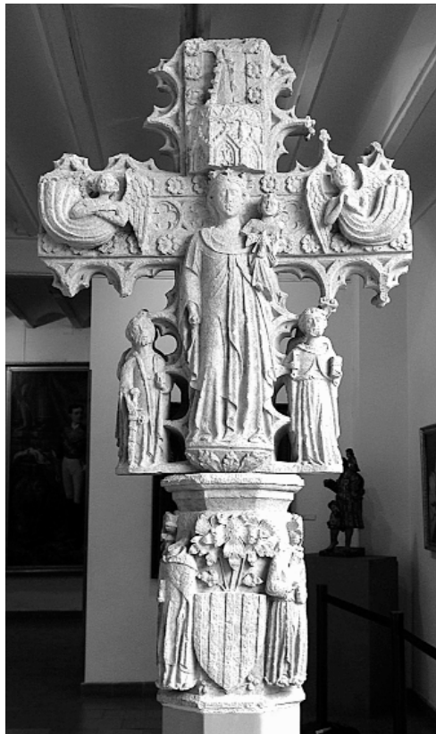
2. Reverso con la Virgen con el Niño entre san Pedro y san Pablo y capitel. Cruz del camino de Valencia, Museu de l'Almodí de Xàtiva .

San Agustín de Hipona se presenta casi siempre como obispo, pero a veces lo hace con el hábito agustino, semejante al franciscano, aunque ceñido por un cinturón de cuero, prenda que no se aprecia en esta imagen. Con ambas indumentarias –hábito negro y vestido de pontifical con mitra y capa pluvial– lo encontramos a la izquierda de santa Ana en el retablo pintado por Joan Reixach en 1452 para la capilla de los Borja de la colegiata setabense. En este caso, su libro de las Confesiones aparece abierto sobre el regazo del santo obispo, pues su mano izquierda sostiene la habitual maqueta que lo identifica como doctor y padre de la Iglesia, mientras que la derecha se cierra sobre el báculo abacial. Con una iconografía semejante, ha sido representado en el guardapolvo