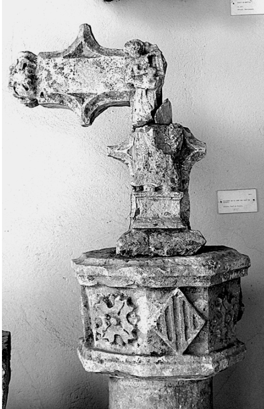
4. Cruz de Canals, Museu de l'Almodí de Xàtiva .

del retablo mayor de la iglesia de san Félix, medio siglo posterior al de santa Ana. No obstante, los agustinos no se instalaron en Xàtiva hasta principios del siglo XVI, por lo que, independientemente de la aparición del santo en otras obras bajomedievales, en tanto fundador de una orden con presencia en Xàtiva no tendría sitio en esta cruz. 6