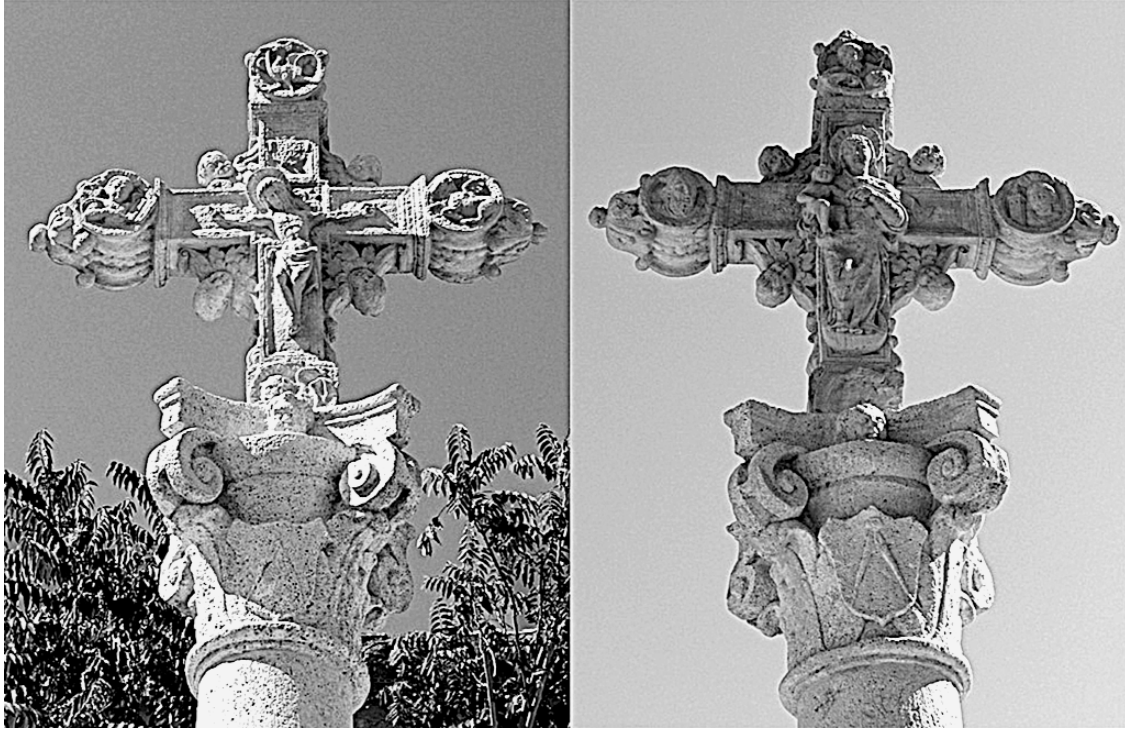
5. Cruz de la ermita de san José y santa Bárbara, Xàtiva.

cia de una buena muerte, 7 es decir para evitar morir de forma trágica, sin posibilidad de confesión. No es casual que esta obra, como otras cruces, se levantara en una intersección de caminos, puesto que las encrucijadas han sido vistas desde antiguo como espacios fronterizos, límites, no sólo entre territorios, sino también entre el mundo de los vivos y el de los muertos, una puerta abierta al más allá, favorable al encuentro con almas en pena. Tanto más por cuanto caminos e intersecciones han sido utilizados como lugares de enterramiento desde época antigua y, especialmente en la Edad Media, como sepultura de aquellos