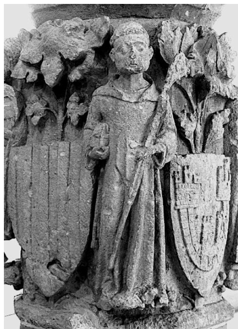
3. Escudos del reino y del municipio, posible imagen de san Benito, capitel. Cruz del camino de Valencia, Museu de l'Almodí de Xàtiva .