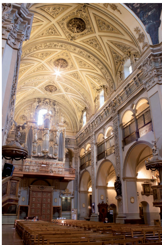
Fig. 3. Calatayud (Zaragoza). Antiguo Colegio de la Compañía. Iglesia. Vista del interior hacia los pies.

En las décadas de 1710 y 1720, la mala situación económica del colegio bilbilitano fue la causa de que únicamente pudieran realizarse en la nueva