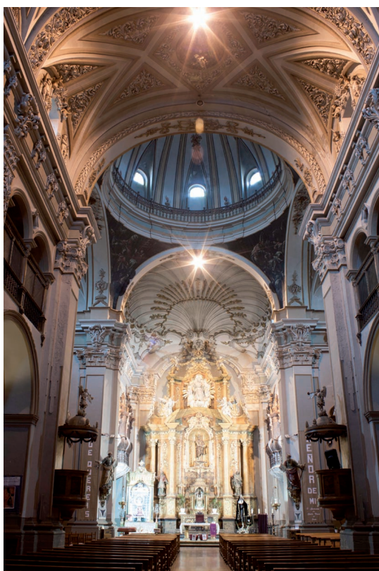
Fig. 4. Calatayud (Zaragoza). Antiguo Colegio de la Compañía. Iglesia. Vista del interior desde los pies.

En 1729 se encargó la colocación de celosías en las tribunas, por motivos de “modestia y decencia”, al igual que cambiar la disposición de la escalera del púlpito, ubicado junto a la capilla de San Francisco de Borja, por la misma razón. 35 El requisito de privacidad quedaba garantizado por estos elementos de control visual, convertidos en habituales desde su colocación en los pequeños balcones o coretti de la iglesia madre del Gesù.