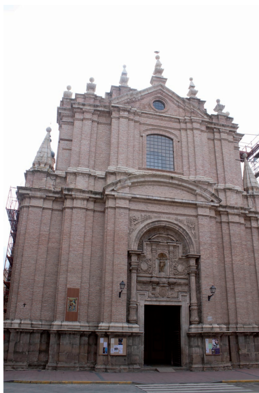
Fig. 2. Calatayud (Zaragoza). Antiguo Colegio de la Compañía. Fachada de la iglesia.

En las tribunas labraría en piedra una columna en medio de cada vano, flanqueándola a ambos lados por dos medias columnas con fustes lisos, todas con sus basas y capiteles compuestos, adornados estos "de talla y fruto y algun pedazo de trapo" o guirnalda. Sobre los capiteles correría "una cornisilla de orden compuesta de la proporción que pide el arte". Las columnas, capiteles y basas debían labrarse "de piedra del genero que es la portada", piedra de color oscuro que debía ser si-