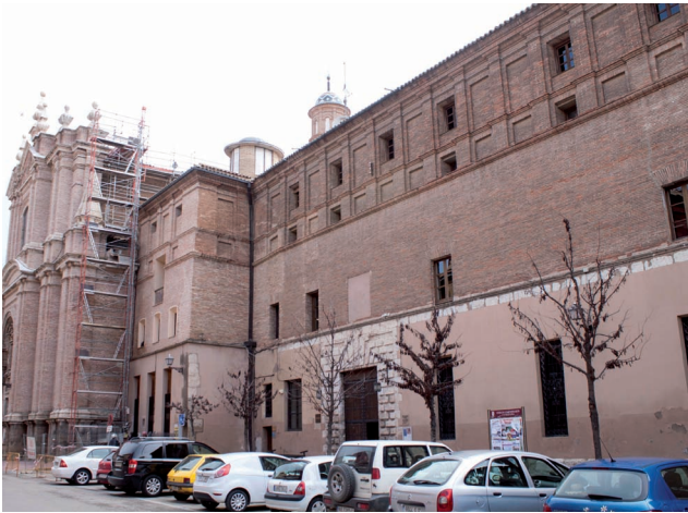
Fig. 1. Calatayud (Zaragoza). Antiguo Colegio de la Compañía. Vista general.

de San Salvador de Calatayud. 2 Transcurrido un mes después de la apertura de las Escuelas de gramática en 1595, el general Claudio Aquaviva dará su aprobación para que la obra del colegio de Nuestra Señora del Pilar comenzara en la primavera de 1596. 3