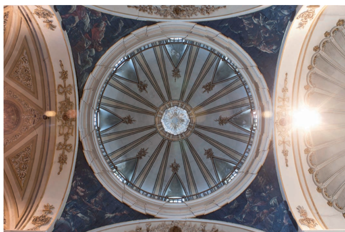
Fig. 6. Calatayud (Zaragoza). Antiguo Colegio de la Compañía. Iglesia. Detalle de la cúpula sobre el crucero.

Por tanto, si exceptuamos la construcción de la sacristía, efectuada entre 1761 y 1763, las obras encaminadas a la conclusión del templo de Nuestra Señora del Pilar se llevaron a cabo entre 1748 y 1762, estando el crucero con la cúpula y el presbiterio finalizados "en lo sustancial" en el año 1756. 49 Todo ello, siempre, bajo el control de los