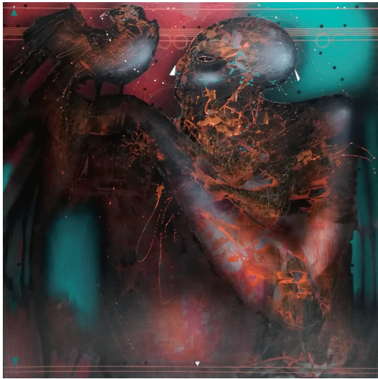
Fig. 5. Personaje con pájaro, 1989. Acrílico sobre lienzo. 160 x 160 cm. Colección particular.