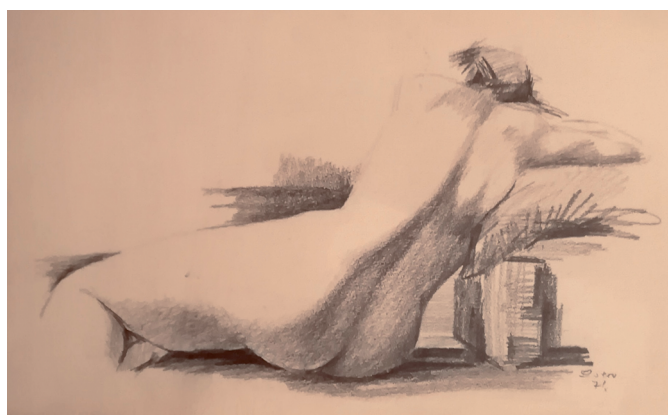
Fig. 3. Desnudo , 1971. Lápiz sobre papel. c. 20 x 30 cm. Colección particular.