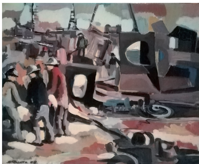
Fig. 2. Estibadores, 1968. Óleo sobre tabla. 60 x 73 cm. Colección particular.

engranajes; otras, en cambio, están selladas de manera intencionada. La representación de las puertas metálicas está a camino entre el terreno mimético y el imaginativo, convirtiéndose en un escenario intermedio entre el mundo real y el imaginario. Un umbral accesible gracias al intelecto o, incluso, a la permisividad del propio artista, quien entrega esa llave a través de puertas abiertas. Buena muestra de ello es Puerta abierta , 31 realizada en 1981, ofreciendo un reto al espectador mediante su halo de misterio e intriga. El espacio vacío, ficticio y atemporal, protagonizado únicamente por estructuras metálicas suspendidas sobre la infinitud, originan un escenario ininteligible e ilimitado.