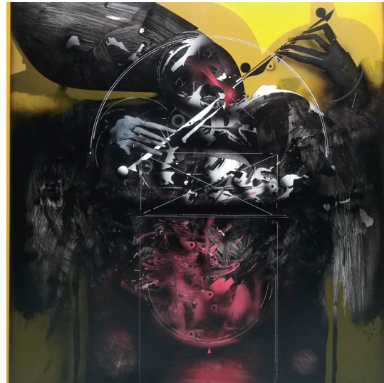
Fig. 6. Músico, 1991. Acrílico sobre lienzo. 160 x 160 cm. Colección particular.