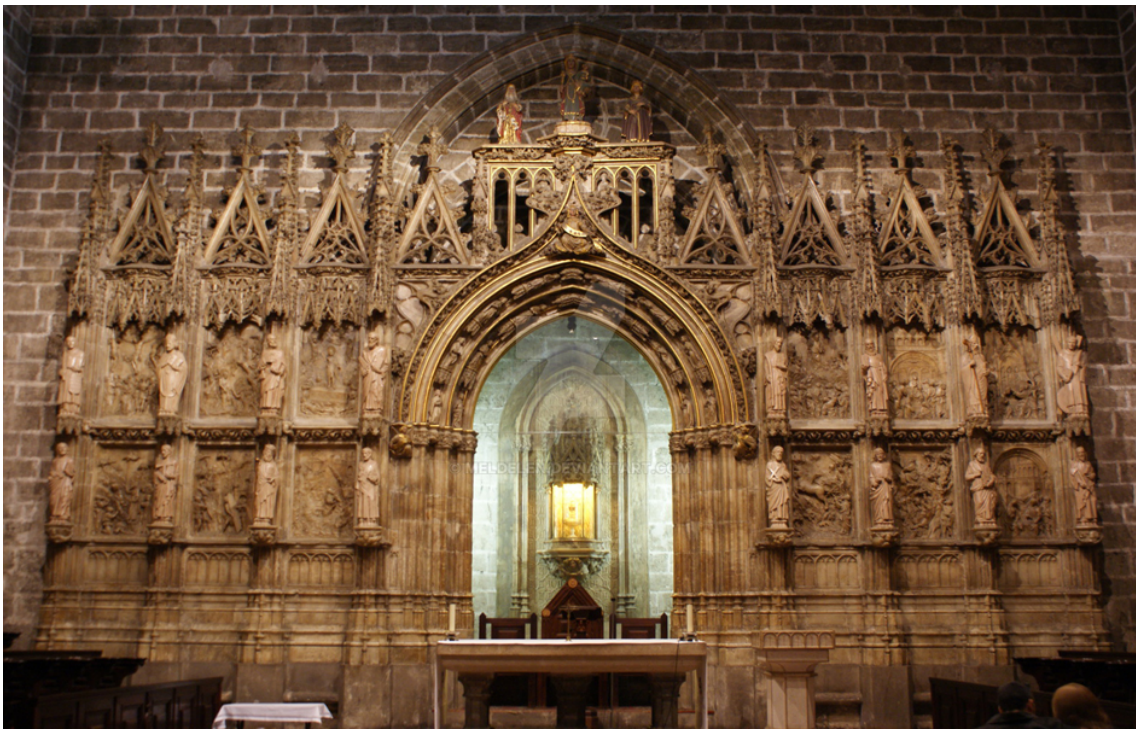
Fig. 6. Trascoro en su actual ubicación, varios autores, 1392-1444, Catedral de València, València.