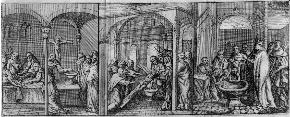
Fig. 5. Retablo de la Passio Imaginis, ca. 1391-1414, Catedral de València, València