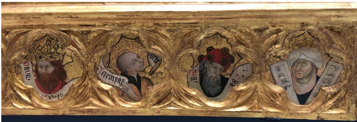
Fig. 2. Detalle de la predela del retablo de los Gozos de la Virgen proveniente de la ermita de La Pobla Llarga, autor desconocido, ca. 1440-1450, Museu de Belles Arts de València, València