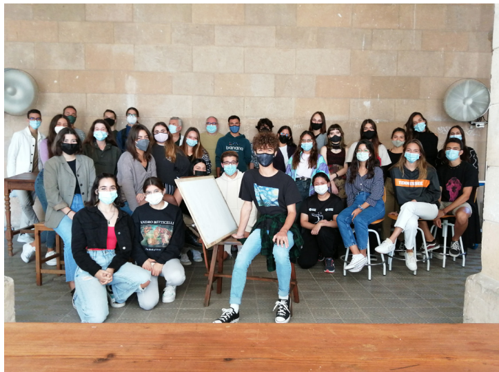
Fig. 2. Participantes de «Tots a taula!».