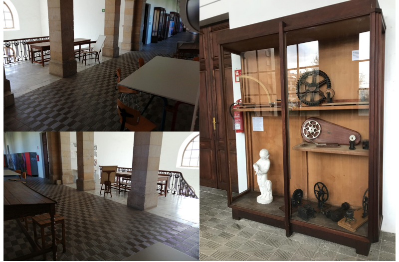
Fig. 7. Exposición «Tots a taula!» y vitrina.

En la fase de comunicación, además de difundir la actividad en redes sociales (Instagram, Facebook del Centro) y organizar la exposición, los propios estudiantes prepararon la nota de prensa para dar a conocer la iniciativa a la comunidad local, por lo que el diario local Última Hora se hizo eco de la experiencia y de la exposición 4 .