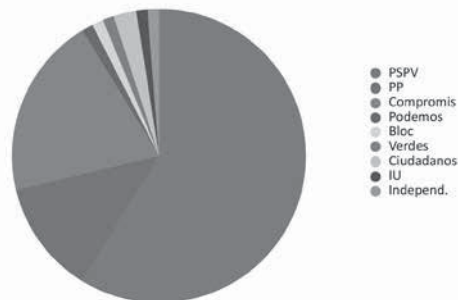
Figura 5. Experiencias de PP por partido político

Y, de la misma manera que encontramos presupuestos participativos en municipios de todo tamaño, lo mismo se puede predicar respecto de sus orígenes políticos. Existen experiencias impulsadas tanto por partidos de izquierdas como conservadores, lo que demuestra la heterogeneidad ideológica. Aunque como se puede ver en la figura 5, el 59% de los municipios con presupuestos participativos tienen alcaldes del PSPV, seguido por el 20% de Compromís. Lo que significa que existe una correlación entre el signo político del alcalde y la posibilidad de poner en marcha una experiencia de presupuesto participativo. Si tenemos en cuenta los 171 municipios investigados vemos que los porcentajes por adscripción del partido político del alcalde corresponden al PSPV con un 51%, a Compromís con un 44% y al Partido Popular con un 36%.