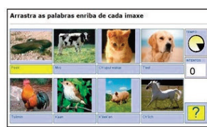
Figura 4. Nombres de animales en maya

Sobre el gaélico, la primera actividad consistió en la proyección del documental Yu ming is ainm dom 8 . En este cortometraje se recoge la experiencia vivida por un joven chino que, decidido a cambiar de estilo de vida, planea una huida a Irlanda y aprende la lengua del país: el gaélico. Al llegar a su destino descubre que la realidad lingüística irlandesa es muy diferente de lo que imaginaba, pues el inglés es el idioma predominante. Tras el visionado del documental, se