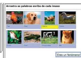
Figura 5. Nombres de animales en maya. Mensaje tras un acierto