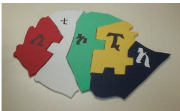
Figura 1. Puzle en amárico (Etiopía).