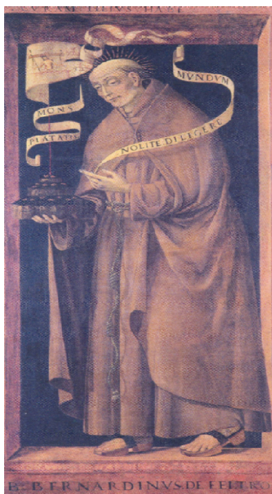
Fig. 4. Vicino da Ferrara, Bernardino da Feltre (Ferrara, Pinacoteca nazionale)

Proprio sul piano iconografico questa immagine — e quella del Monte di Pietà fondato a Ferrara nel 1507 (fig. 4) che contiene il medesimo Cristo passionato ed il messaggio francescano del «nolite diligere mundum») — testimoniano la saldatura di un lungo percorso lessicale, retorico-argomentativo e pedagogico sviluppato dal minoritismo che da oltre due secoli aveva saputo penetrare, comprendere e codificare, prima ancora delle norme civili, una serie di Sprachbilder capaci di fondare l'accettabilità di determinati valori e costruire in tal modo la legittimazione di un'ideologia civile.