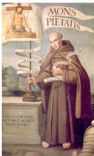
Fig. 3. Stendardo del Monte di Pietà di Reggio Emilia (fond. 1494) con Bernardino da Feltre (Reggio Emilia, Bipopo Carire)

rappresenta la forza e l'orgoglio di una comunità. Una comunità legittimata a praticare una politica creditizia che offre sicurezza economica e coesione civile a chi si riconosce nella fidelitas e nella credibilità cristiana. Non a caso il mutuo e le pratiche creditizie messe in atto con i Monti di Pietà vennero, nei testi dell'epoca, definite di «mutuo civile». 7 La solidità marmorea del monte, il sacco ricolmo di denaro, la presenza di Cristo passionato, la funzione pedagogica di chi sa interpretare il senso della paupertas volontaria e l'uso appropriato delle ricchezze («nolite diligere mundum») esprimono al massimo livello il senso ed il valore di questa impresa civile: «Haec est victoria / Quae vincit mundum / Fides nostra»; è questa l'epigrafe scolpita nella base marmorea su cui poggia lo stendardo del Mons Pietatis .