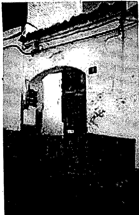
Fig 5. Lugar de la última tenería.