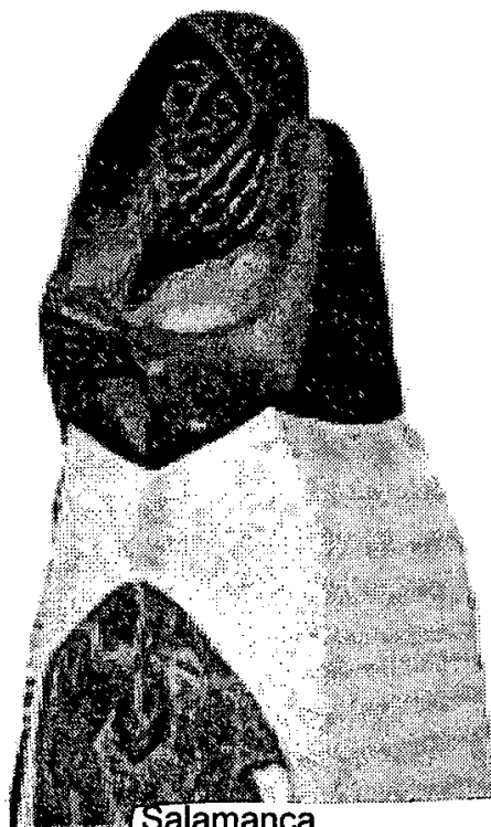
Salamanca. Nuevo monumento a Celestina.