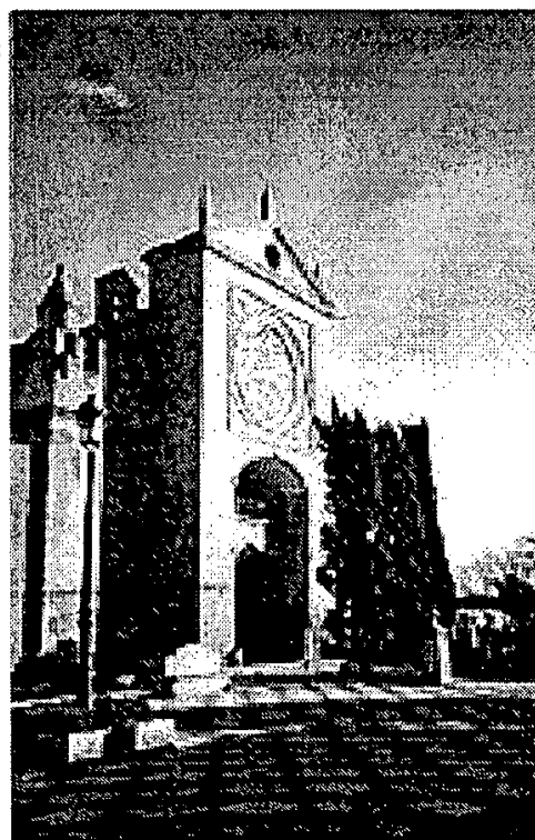
Fig 10. Talavera, Santa María la Mayor.