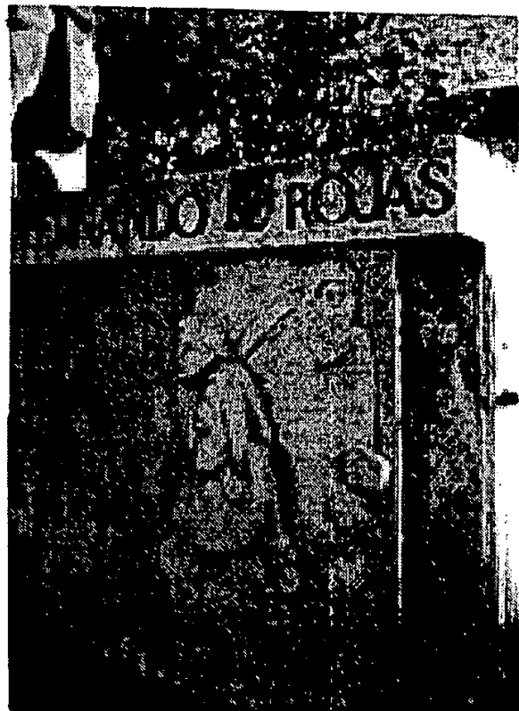
Fig 3. Bajorrelieve de Calisto y Melibea.