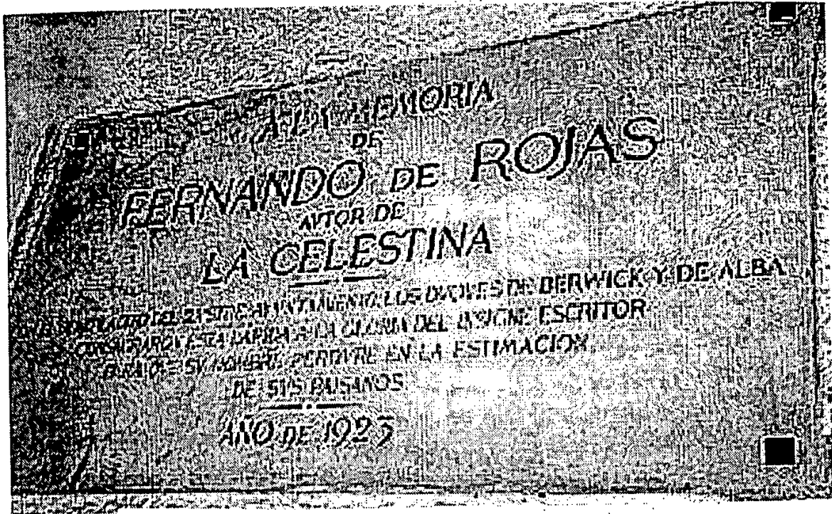
Fig 1. Ayuntamiento de la Puebla de Montalbán.