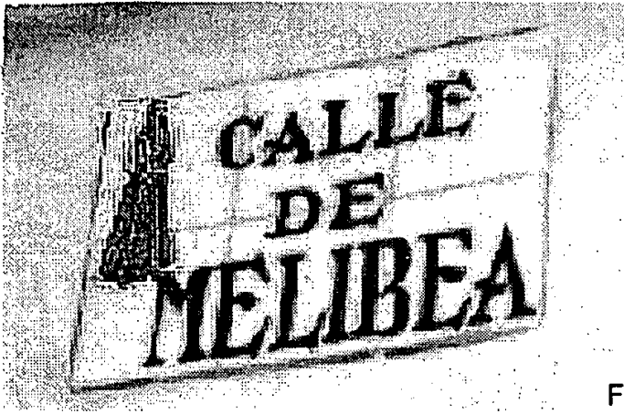
Fig 6. En la Puebla de Montalbán.