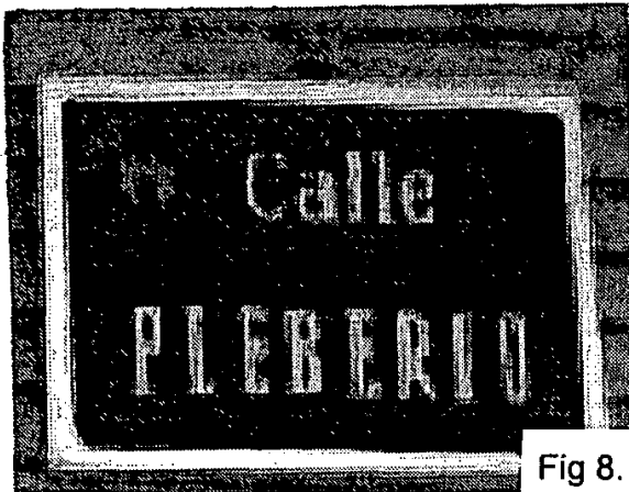
Fig 8. Un tercer lugar en la Puebla de Montalbán.

después el significado de 'La Celestina' en el campo de la Literatura española y mundial. Seguidamente intervino el Sr. [Pedro] Laín Entralgo, quien, refiriéndose principalmente al aspecto médico de la obra, estudió la naturaleza en los escritos de Fernando de Rojas. Por último, los poetas señores [Luis] Rosales y [Luis Felipe] Vivanco leyeron unas cuartillas glosando poéticamente pasajes de 'La Celestina'."