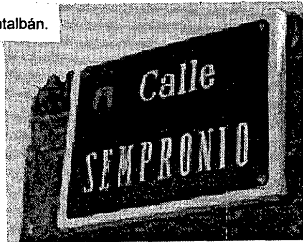
Fig 7. Otro lugar de la Puebla de Montalbán.