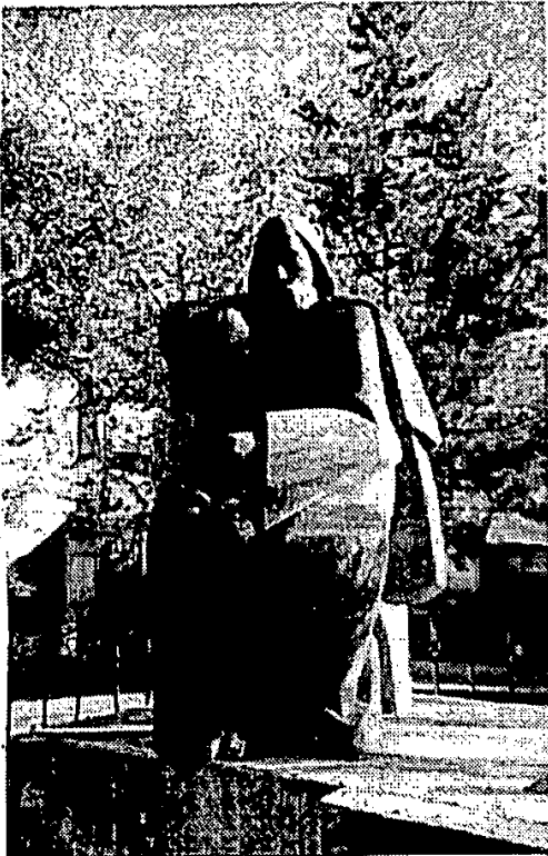
Fig 2. Fernando de Rojas.