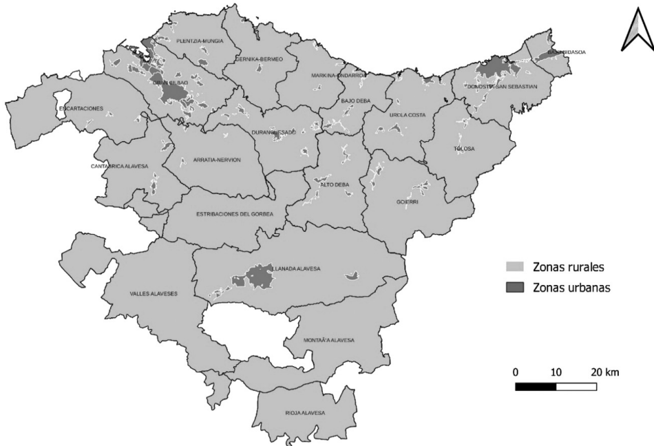
Mapa 1. Medio rural objeto del programa Leader en el País Vasco (23-27)