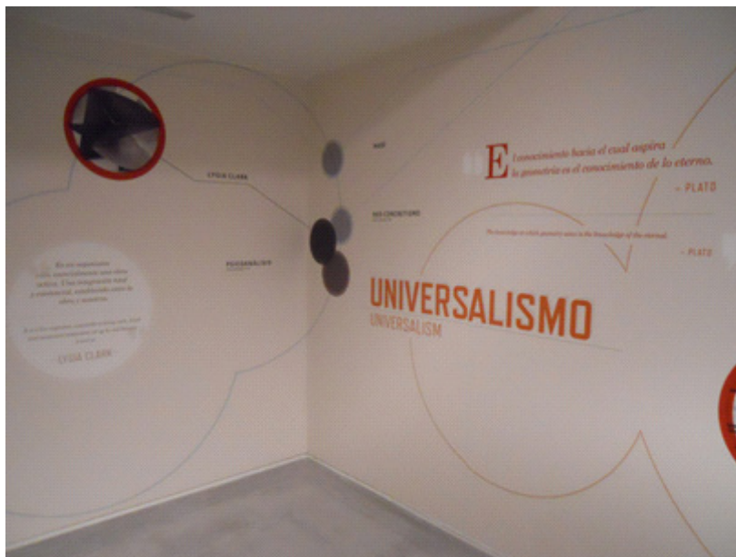
Figura 2. Vista del diagrama mural en la exposición La invención concreta. Colección Patricia Phelps de Cisneros en el MNCARS en 2013.

En mitad del recorrido por las salas de la exposición, se encontraba una sala aparte dedicada a un diagrama mural . Esta sala era rectangular y diáfana. En su interior había dispuestas tres mesas blancas alargadas con aparatos electrónicos de iPads donde poder consultar y navegar por la aplicación digital de la exposición (gratuita), para sistemas operativos de iPad y de iPhone, respectivamente. También se encontraban libros especializados en la temática de la exposición para su consulta. El diagrama mural se refiere a la representación gráfica que se extendía a lo largo de los cuatro muros de la sala. Estuvo compuesto por formas circulares, palabras clave y líneas. Las formas circulares ordenaban visualmente los contenidos, cuya estructura seguía los cinco bloques temáticos principales de la exposición. Las líneas se utilizaban para unir visualmente entre palabras y fragmentos clave y, así, representar la afinidad temática y las relaciones de influencia entre sí. Las palabras clave eran de nombres de artistas de la exposición, así como de otras personalidades científicas e históricas y de movimientos artísticos que habían sido de influencia sobre estos artistas y su producción artística. En conjunto, este diagrama mural representaba gráficamente una síntesis de las referencias teóricas, históricas, científicas y artísticas principales para la producción artística de las obras expuestas.