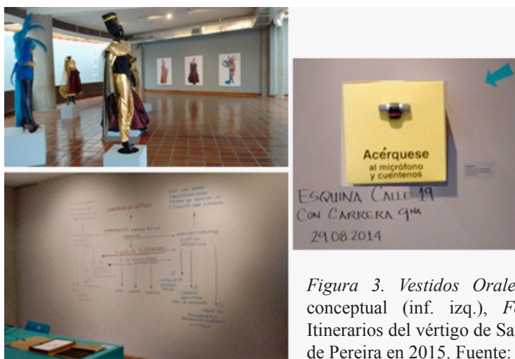
Figura 3. Vestidos Orales (imagen sup. Izq.), mapa conceptual (inf. izq.), Fobófono (dcha.). Exposición Itinerarios del vértigo de Sandra Silva en el Museo de Arte de Pereira en 2015.

Otro de los elementos museográficos insertados en sala en esta exposición se trató de un mapa conceptual sobre uno de los muros. En concreto, este se dispuso en uno de los muros de la entrada a la exposición. Estaba compuesto por palabras clave y ordenadas entre sí a modo de esquema visual. La parte central y concéntrica indicaba “INVESTIGACIÓN BASADA EN LA CREACIÓN”; arriba, “ITINERARIOS DEL VÉRTIGO”; debajo, “A partir de LO RELACIONAL y LO CONTEXTUAL”; en los laterales, “ACONTECIMIENTOS ESTÉTICO-ARTÍSTICOS”, junto a “1.INSTALACIÓN VESTIDOS ORALES”, “2.CRÓNICA AUDIOVISUAL DÍAS DE AFRODITA” y “3.LIBRO DE PENSAMIENTO Y PRODUCCIÓN ESTÉTICO-ARTÍSTICO”; y, también en los laterales, “PROVOCACIONES ESTÉTICO ARTÍSTICAS, junto a “1.MAPA SIMBÓLICO DEL MIEDO”, “2.FOBÓFONO” y “3.REGISTRO AUDIOVISUAL VESTIDOS ORALES”. De este modo, este mapa conceptual reunía el total de cuestiones principales, obras y artefactos de la exposición y servía a modo de síntesis gráfica de esta.