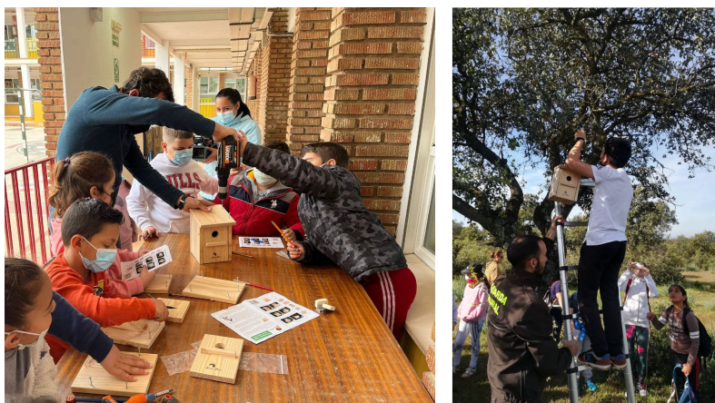
Figura 6A. Taller de elaboración de cajas nido con alumnado del centro. Figura 6B. Alumno colocando en una encina del Monte Público Burguillos una de las cajas nido construidas.

La elaboración de dichas cajas nido implicó la realización de una nueva actividad consistente en la instalación de las mismas en el entorno natural, concretamente en el Monte Público Burguillos, ubicado en una de las faldas de Sierra Morena Oriental, en el término municipal de Bailén. Allí, los guardas rurales de este espacio pudieron informar al respecto de las especies de aves susceptibles de ocuparlas para nidificar.