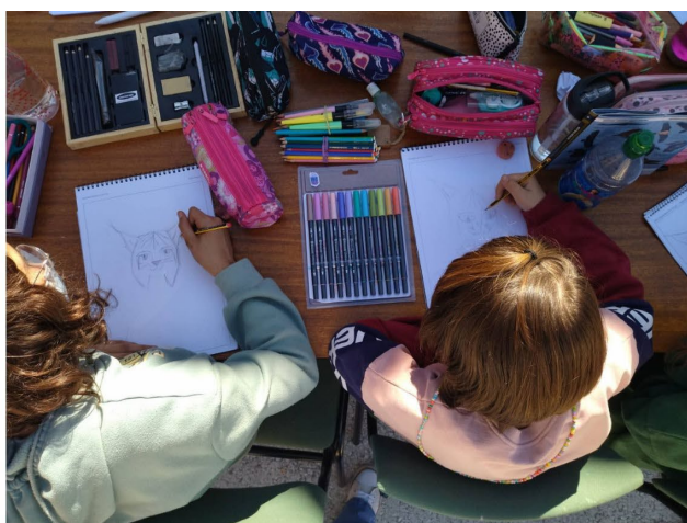
Figura 3A. Taller de dibujo naturalista en el patio del CEIP 19 de Julio, impartido por el autor del mural. Figura 3B. Alumnas dibujando lince ibérico en el taller.