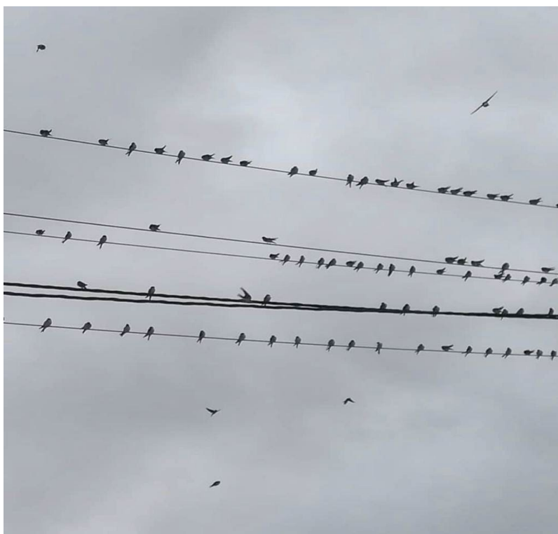
Figura 1. Aviones comunes en cableado eléctrico. Fuente: los autores.

El característico plumaje de los aviones comunes permite diferenciarlos de otros hirundínidos como las golondrinas u otras especies de aviones. Su dorso es de color negro con reflejos azulados, y tienen el obispillo y la parte inferior de color blanco. Su tamaño también es inferior al de otras especies como la golondrina común Hirundo rustica o la golondrina dáurica Cecropis daurica , así como la longitud de su cola. Por último el carácter gregario de esta especie y su nidificación en colonias la diferencia del resto de especies, que prefieren realizar sus nidos de barro en solitario o en comunidades mucho menos compactas (Calleja et al., 2006). La figura del avión común es utilizada en el mural como alegoría de las notas negras y blancas incluidas en una partitura, en clara alusión a las estampas otoñales que llevan a esta especie a reunirse sobre el cableado de los tendidos eléctricos tras la reproducción estival, justo antes de emprender de nuevo la migración rumbo al golfo de Guinea.