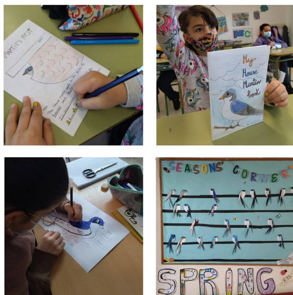
Figuras 7A, 7B, 7C y 7D. Actividades realizadas por el alumnado en torno al avión común, en el marco del proyecto bilingüe del centro educativo.

Por último, en el curso 2021-2022, el centro puso en marcha un proyecto bilingüe denominado “Stop Climate Change”, que surge de la necesidad de profundizar en la educación ambiental, de reflexionar sobre los hábitos y rutinas y cómo éstas afectan al medio ambiente, y del interés de los niños por conocer más la fenología del avión común, a raíz del conocimiento del profesorado de la existencia de una de las mayores colonias de aves del municipio fruto de la intervención mural realizada. El proyecto tiene como finalidad poner en marcha experiencias innovadoras para motivar al alumnado en el uso del inglés, y por otra parte, generar comportamientos responsables con el entorno, así como su educación ambiental. Este proyecto fue galardonado con el 3º Premio de Buenas Prácticas en Enseñanza Bilingüe en la categoría de Educación Infantil y Primaria, otorgado por la Junta de Andalucía en su convocatoria de 2022.