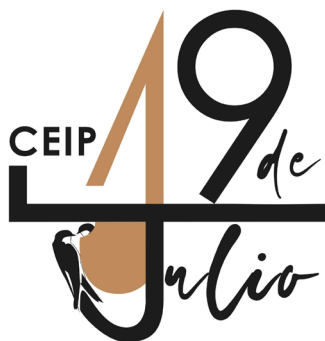
Figura 5. Nuevo logotipo del CEIP 19 de Julio, incorporando elementos definitorios como el avión común, la efeméride que da nombre al centro y el barro, definido en el nido y en el número uno, que hace referencia al monumento a la Batalla de Bailén, construido con la drillos y ubicado en el Paseo de las Palmeras de la localidad.

Otras de las actividades posteriores fueron desarrolladas con la participación de profesionales pertenecientes a empresas y entidades de carácter conservacionista y del ámbito de la naturaleza, concretamente de la Sociedad Ibérica para el Estudio y la Conservación de los Ecosistemas SIECE. La primera de estas acciones consistió en un taller de elaboración de cajas nido para aves insectívoras, ya que durante los procesos de ejecución del mural se fueron explicando el papel tan importante que las aves insectívoras ocupan en los ecosistemas y lo beneficiosas que son para el ser humano.