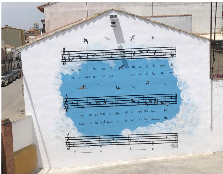
Figura 2. Vista del mural realizado en el CEIP 19 de Julio.