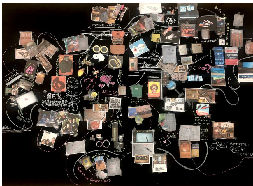
Figura 4. Atlas elaborado en el curso Pedagogías Culturales.

La reflexión desde la construcción práctica de un panel de trayectos autobiográficos nos permitió también algunos elementos propio de la cartografía, del modo en que lo hemos señalado antes.