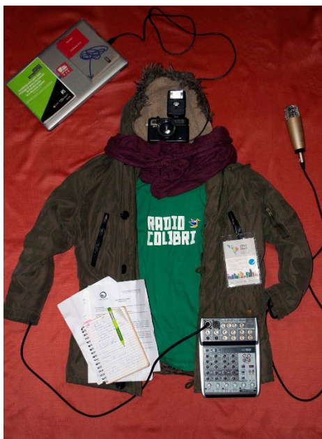
Figura 2. Repertorio de imágenes para la cartografía de E.B.

Nota: Elaboración propia, 2022, sobre fuente de los autores en base a imágenes proporcionadas con autorización del estudiante.