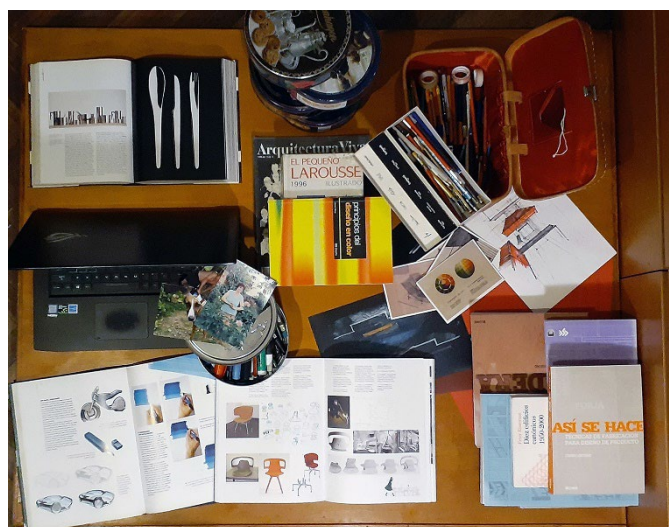
Figura 3. Repertorio de imágenes para la cartografía de A.S.

A.S., docente universitaria, graduada en Arquitectura, trajo a clase una serie de libros vinculados al Diseño y la Arquitectura junto con una vieja versión de El pequeño Larousse ilustrado , diccionario básico de lengua española, de uso muy común en el sistema educativo en general. La serie se completaba con un ordenador portátil, latas de galletitas danesas que guardan numerosos objetos de dibujo, y también postales con cartas de color, y hasta una pequeña serie de fotografías personales. Todo esto, dispuesto en la mesa de trabajo habitual.