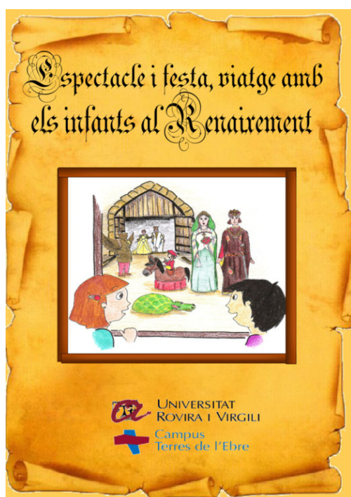
Fig 3. Portada del proyecto. Realizada digital y manualmente por los alumnos de 3º de Grado de Educación Infantil del Campus Terres de l'Ebre de la Universidad Rovira i Virgili. Curso 2011-2012.

4.10. Plomes, corona, cascavells i... acció! Arriba l'àliga tortosina!