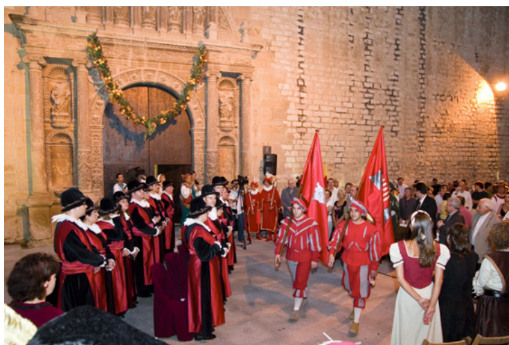
Fig 2. Fachada del CIR durante la celebración de la Festa del Renaixement .

[...] mirau los col·legis reals que en Sent Domingo se fabriquen, lo hu per a instruir los fills dels nous christians convertits de la secta maomètica y l'altre per llegit theologia y altres sciències, que magnífica obra és. 2