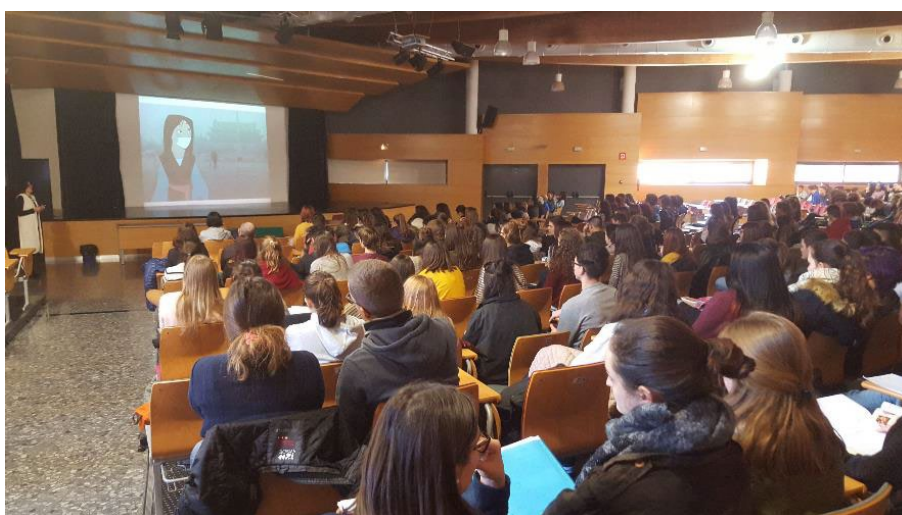
Figura 1. Las acciones del proyecto Second Round han tenido siempre muy buena acogida en los institutos de secundaria. Conferencia en el IES Benlliure de València.