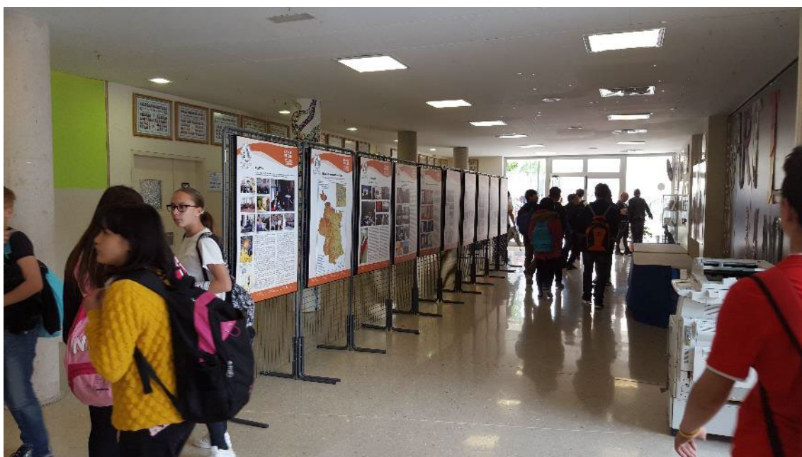
Figura 2. Un conjunto de paneles sirve para difundir en los centros el proyecto Second Round . La exposición viene acompañada de otras actividades paralelas. IES Manises.

de distancia, para la mayoría del alumnado, el lugar donde estudia el máster de profesorado no deja de ser un sitio de tránsito. A pesar de los inconvenientes, desde el máster se realiza un intenso trabajo encaminado a fortalecer la formación pedagógica del futuro profesorado de Dibujo. Se transmite la posibilidad de investigar en temáticas propias de la educación en artes. Una de las acciones colaborativas del proyecto ha sido la creación de la película Lineas, Second Round Movie . En línea con el fomento del audiovisual, hemos optado por la fórmula de las “píldoras audiovisuales”, porque consideramos que se trata de un recurso ágil y estimulante, fácil de llevar al aula, y muy instructivo, teniendo en cuenta los hábitos de los estudiantes adolescentes, que prefieren recibir la información en imágenes desde dispositivos digitales. Este recurso también permite dar a conocer el trabajo del profesorado en distintos entornos creativos o en el ámbito informal, incluyendo el papel de los museos en todas estas acciones de formación.