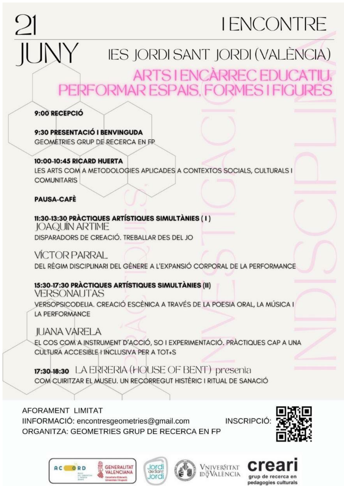
Figura 4. Cartel de actividades de una de las jornadas organizadas desde el proyecto ACORD en el IES Jordi de Sant Jordi de València.