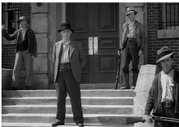
Los dos planos de la izquierda corresponden a Furia ( Fury , Fritz Lang, 1936). A la derecha, planos análogos de El cebo

Se suele mencionar M, el vampiro de Düsseldorf ( M , Fritz Lang, 1931) como antecedente de El cebo . El título con el que se estrenan ambas en Italia es paradigmático del paralelismo buscado: M, il mostro di Düsseldorf , la de Lang, e Il mostro di Magendorf , la de Vajda. Las diferencias entre ambas son más que notables, sobre todo porque la película de Vajda focaliza la acción en el perseguidor y no en el perseguido. Otra película de Lang está en el origen de la escena del linchamiento: Furia ( Fury , Fritz Lang, 1936). Vajda ya había citado esta dependencia durante el