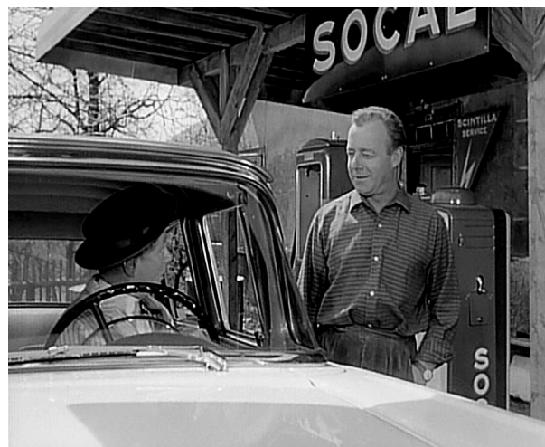
La imagen de la izquierda presenta a Heinz Rühmann en El trío de la bencina . ( Die drei von der Tankstelle , Wilhelm Thiele, 1930). A la derecha, un plano análogo de El cebo