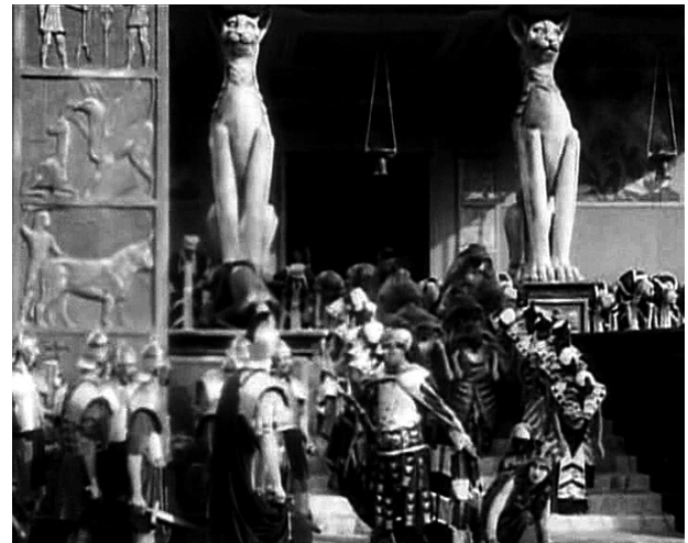
La imagen superior corresponde a Quo vadis? (Enrico Guazzoni, 1913) y las dos siguientes, a Cabiria (Giovanni Pastrone, 1914)