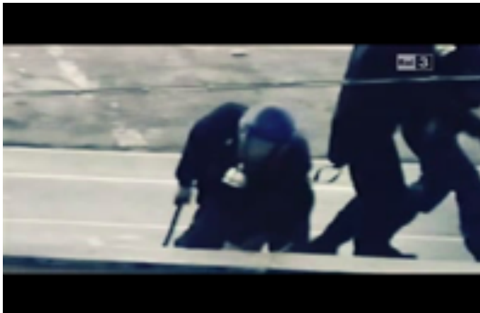
Fotograma 2 (arriba), fotograma 3 (abajo)

política de estado de excepción, mezclado con tecnologías del miedo. A través del análisis de este texto fílmico, es posible afirmar que la violencia gubernamental realizada durante el G8 de Génova entra en el estado de excepción y de derecho como elemento fijo que decreta el poder de la soberanía sobre la vida y sobre la muerte de los sujetos: el poder sobre la vida avalaría así el poder de dar la muerte. La película Black Block representa nuevas formas de control y de dominación de los sujetos y de las comunidades que se pueden identificar con los aparatos necropolíticos a través de la instauración de un estado de excepción y de una idea ficcionalizada del enemigo. Durante el G8 de Génova, este estado de excepción y de emergencia llegó a identificarse con la injustificada sensación de amenaza causada por las manifestaciones