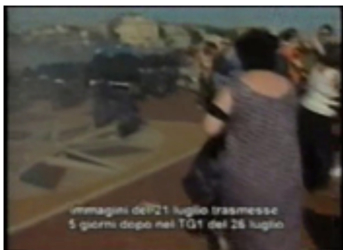
Fotograma 16 (arriba), fotograma 17 (abajo)

les durante el G8 de Génova, estamos investigando sobre las nuevas formas de las relaciones de poder que se están desarrollando en nuestro tiempo y que están definiendo la nueva tipología de sociedad en la que viviremos.