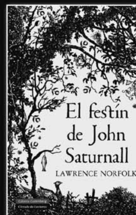
Lawrence Norfolk El festín de John Saturnall