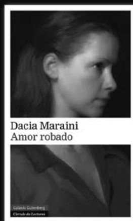
Dacia Maraini Amor robado