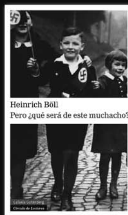
Heinrich Böll Pero ¿qué será de este muchacho?