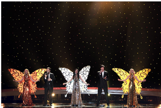
Figura 4. El conjunto 3+2 en el puente de su actuación (Fuente: ShowLED).

te en 2013, al triunfar nuevamente en el Eurofest con el tema «Rhythm of Love». Pero como este había sido lanzado antes del plazo de la UER, poco después se modificaría por «Solayoh» (RTVE). Como dato significativo, en 2020, a pesar del dilema de 2012, Lanskaya fue entrevistada por Érika Reija para TVE con motivo de las disputas en la república, siendo hasta ahora la única exrepresentante del país en el Festival que apoya públicamente al presidente (Reija).