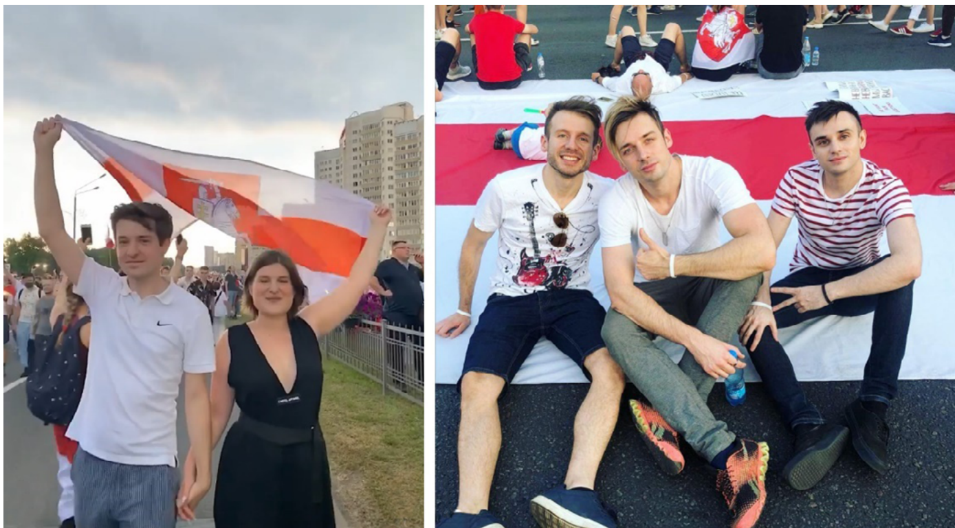
Figura 7. VAL (izq.) y Litesoud (der.) en las manifestaciones (Fuente: Instagram).

actividades simples como «bailar al son de una melodía» o «a morder el anzuelo» (Galasy ZMesta, 2021a, versos 14-15). Dos días después de su publicación, la UER anunciaba que el tema ponía en tela de juicio la naturaleza apolítica del Festival y se notificó a la delegación bielorrusa la posibilidad de presentar uno nuevo acorde con las reglas del concurso.