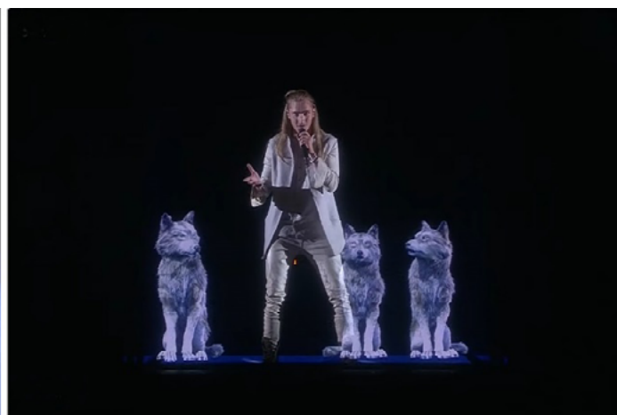
Figura 2. La propuesta estética de IVAN para Eurovisión 2016.