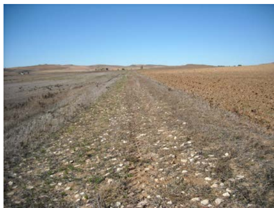
Fig. 4: El llamado “Camino romano” en término de Villarejo de Fuentes.

Tal y como se ha apuntado, el epígrafe fue reutilizado, y por tanto no se encontraba en su lugar de origen, pero a unos 200 m al S de este punto se localiza el yacimiento de La Pioja, en el mismo término municipal de Villarejo de Fuentes. Dicho enclave se sitúa en la parte alta y media de un promontorio y el lugar ha sido estudiado en dos ocasiones; la primera, con motivo de la realización de la Carta Arqueológica de Villarejo de Fuentes 5 , y la segunda con ocasión de los citados trabajos preventivos inherentes a las obras públicas, lo que permite poder adscribirlo a época romana (ss. I-III), contando con un área de dispersión cerámica de unas 2 ha. Por otro lado, a unos 800 m al O del mismo se encuentra otro enclave de la misma cronología, pero con una mayor presencia de material cerámico, entre el que desatacan los fragmentos de terra sigillata hispánica, ánforas, dolia , cerámica común, etc., a lo que hay que sumar una ingente cantidad de restos de tegulae .