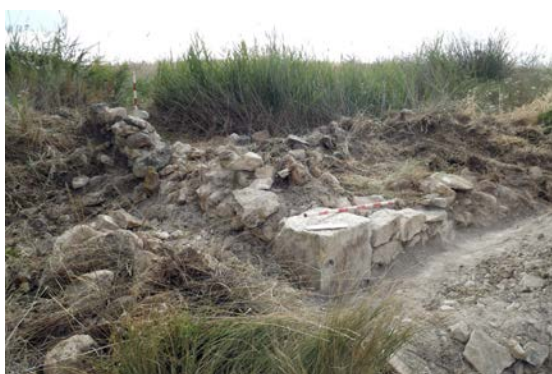
Fig. 2: Altar de Villarejo de Fuentes in situ en el momento del descubrimiento (Foto: M. Á. Valero).

A unos 1300 m al N del lugar de hallazgo de esta estela se encuentra el yacimiento de Los Villares, con unas dimensiones de casi 24 ha y numerosos restos cerámicos en superficie. El lugar ha sido prospectado en el ámbito de proyectos como “El territorio ibérico en la Manchuela” 2 (Valero 2008: 160 ss.) o “Carta Arqueológica de Ledaña” 3 , lo que ha permitido el análisis de una muestra de material cerámico que, pese a ser aleatoria, indica una presencia humana en tiempos ibéricos y una mayor intensidad de ocupación en época romana. No existen otros testimonios que apunten a la presencia de un yacimiento bajo el trazado urbano de la localidad. En todo caso, el hallazgo de la estela de un soldado sin ciudadanía, es decir, habitante de un enclave estipendiario, apunta a la existencia aquí de una necrópolis asociada al enclave de Los Villares ya citado.