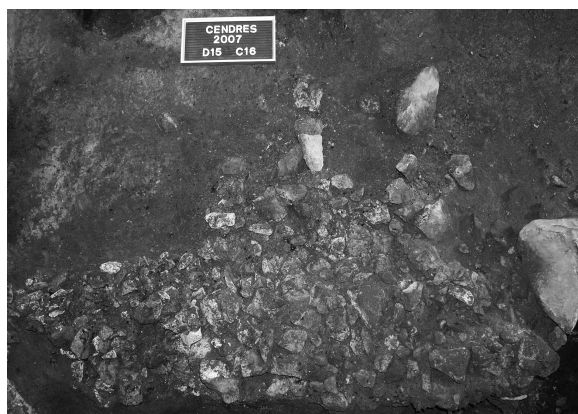
Fig. 2. Detall de la base de l'estructura de combustió del sector A. L'altra meitat va ser excavada en la campanya de l'any 2003.

com un elevat nombre de peces d'indústria òssia: atzagaies, agulles i arpons. El fet d'haver trobat algunes restes dels processos de fabricació d'aquests elements (varetes de fabricació), en inclina a pensar que ens podríem trobar en un lloc de manufactura o reciclatge d'indústria sobre os i banya.