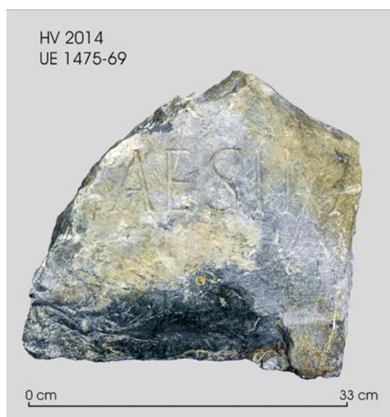
Fig. 3: Fragment núm. 1-b.