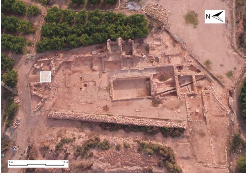
Fig. 1: Fotografia zenital de la vil·la amb el lloc de la troballa dels fragments epigràfics.

l'altura del monument, que era major de 64 cm. Segons la nostra interpretació del text, el primer (a) correspon a la zona centreesquerra de la part superior, i el segon (b) devia situar-se cap a l'angle inferior dret.