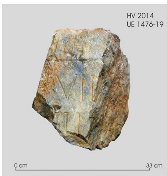
Fig. 2: Fragment núm. 1-a.