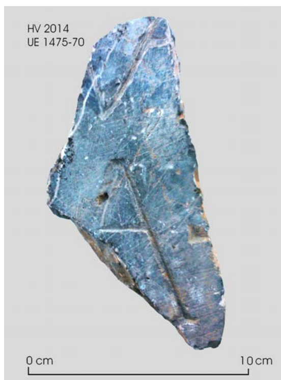
Fig. 5: Fragment núm. 2.

L'altura de les lletres és de 7,3 cm i la interlineació d'1,7 cm. El camp epigràfic està allisat i conserva traces fines de poliment. La lletra és elegant, de solc un poc irregular, i compta amb reforços. Conserva un