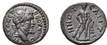
2b. AE, 18-20 mm, 4,30 g (2). Axe : 6

1. Paris FG 1067, 2,97 ; 2. Lanz 117, 24 Novembre 2003, lot 874, 3,99 ; 3. Gitbud et Naumann 19, 6 Juillet 2014, lot 402, 3,87 ; 4. Gitbud et Naumann 34, 2 Août 2015, lot 680, 4,45 ; 5. Collection CGT (ex London Ancient Coins 39, 18 Novembre 2014, lot 100), 3,52.