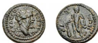
3. AE. 17-18 mm, 2,84 g (3). Axe : 6

1. Copenhague SNG 406, 2,86 ; 2. CNG 90, 23 Mai 2012, lot 1001, 5,75.