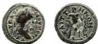
1b. AE, 18 mm. 3,86 g (6). Axe : 6

AY K•Λ•CE••CEOYHPOC••ΠE•; tête laurée de Septime Sévère, à dr.