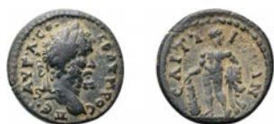
2a. AE, 18-20 mm, 3,76 g (5). Axe : 6

1. Numismatik Naumann 44, 7 Août 2016, lot 626, 3,79 ; 2-6. Collection CGT, 4,76, 4,05, 3,86, 3,54, 3,13.