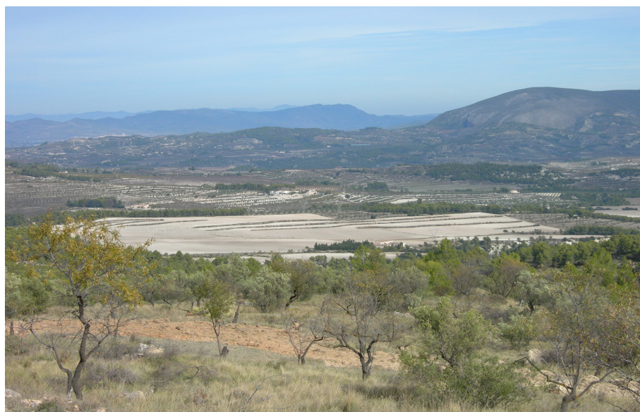
Fig. 1. Vista parcial de les valls del Serpis, en primer pla el jaciment de Les Baquerisses (Benifallim).

Maset, Alt del Regadiuet, Florències, Lloma de la Devesa), dos a la vall de Planes (Tros de la Bassa, ac-157), un a vall del Trabadell (Castell de Trabadell) i huit a la vall del Zeta (Barranc de Cormellar, El Sobirà, Camí del Reallenc, ac-213, ac-302, Mas de Quintín, P1, P2). Aquestes visites s'han centrat en: la documentació de les estructures conservades mitjançant la realització de tasques de documentació (fotografia digital i planimetria entre altres); en precisar qüestions de cronologia, com al Mas Blanc, doncs la recuperació d'un fragment de ceràmica amb diferents incisions perpendiculars, un gratador proximal i una fulla ens permet establir junt a la cronologia, ja coneguda, una presència humana al Mas Blanc a finals del NIB inici NIC de la seqüència regional. Finalment aquestes visites també ens han permès aproximar-nos a l'extensió dels jaciments. D'especial interès resulta la prospecció realitzada al Castell de Trabadell situat al municipi de Millena. A la vessant oriental del castell medieval, junt a la dispersió de material arqueològic s'han documentat restes de murs. La combinació de l'extensió màxima de la dispersió i els murs més exteriors documentats ens han permès aproximar-nos, grosso modo , a la grandària màxima d'aquest emplaçament associat cronològicament a l'horitzó Campaniforme.