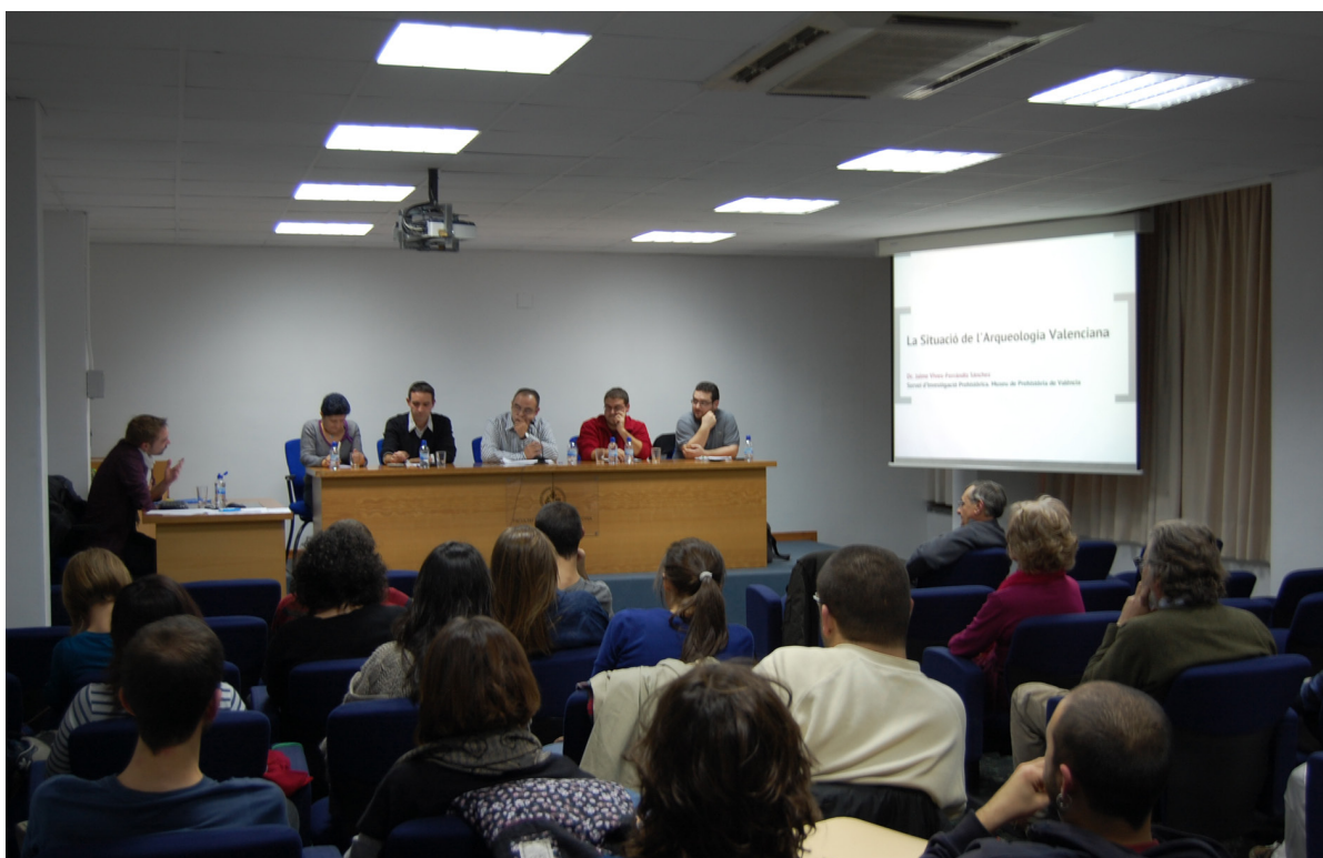
Fig. 2. Instantània del debat.

assistir a l'acte. A partir de les seues visions sobre la situació de l'arqueologia valenciana es va generar un debat en el qual participaren tant els membres de la taula redona com els assistents presents a la sala, i que s'allargà durant tres hores.