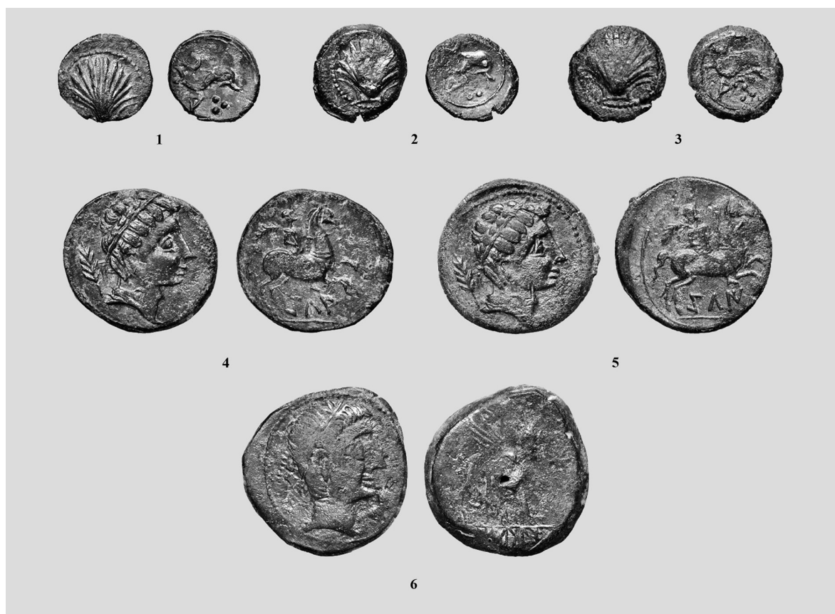
Fig.2. Conjunto de hallazgos monetarios estudiados. Los números se corresponden con las referencias del texto. Escala 1:1.

318/3), en Cerro Santo o Castellar de Hortunas (Requena) (Pérez Mínguez 1988: 395). En Kelin también se hallaron 24 unidades y 11 cuartos de Arse , mientras que de los yacimientos sinarquieños de Cañada del Pozuelo y Cerro de San Cristóbal proceden otros dos cuartos más (Iranzo 2004: 177 y 211). Por último, en cuanto a la moneda de Castulo , podemos aseverar que es uno de los talleres de la península Ibérica que mayor número de monedas puso en circulación y se encuentra representado con 29 unidades y 13 mitades en Kelin , de los que 10 unidades pertenecen al mismo grupo del que aquí presentamos (Ripollès 1982: 208), dos unidades en el Cerro Carpio (Sinarcas), una en La Cabezuela/ Pocillo de Berceruela (Sinarcas) (Iranzo 2004: 181 y 207), una unidad en los Corrales de Utiel (Ripollès 1980: 52), otra en La Vereda (Camporrobles) y una mitad en El Molón (Camporrobles) (Ripollès y Gómez 1978: 211-212). Por lo tanto, se trata de tres cecas que están bien representadas en Kelin