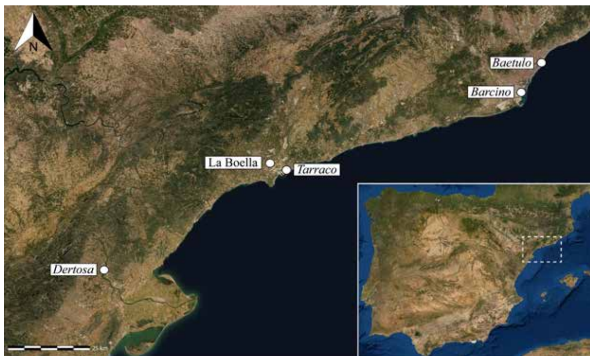
Fig. 1. Mapa de situació del jaciment de La Boella.

Davant la imprecisió genèrica d'aquestes dades, l'element que pren més interès és el sistema de filtratge amb dolium que acabem d'esmentar, que està ben descrit en la citada publicació de Massó. Aquest, però, es va trobar a una certa distància, uns 500 m al NO del mas, i per tant una mica allunyat de la zona on es troba l'escampall de ceràmica romana. Era una conducció d'aigua que tenia un sistema de decantació consistent en un dolium al qual entrava l'aigua per un canal en secció de U i sortia l'aigua neta per una peça de terrissa tubular dotada d'un filtre en un extrem (les impureses quedaven dins del contenidor). Aquest dolium ostentava dos segells i un grafit que han estat estudiats per Piero Berni (2010). El grafit, incomplet, informa de la seva capacitat, en amphorae XXIV s(extarii) XI , és a dir, 638,74 litres, que queden