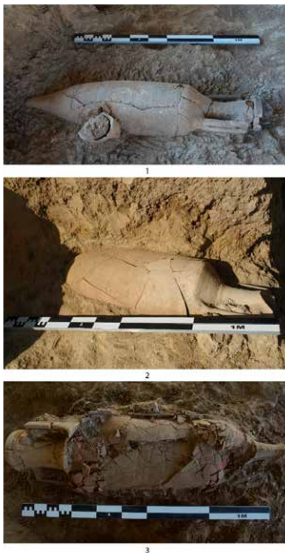
Fig. 2. 1. Foto en detall de la Dressel 2 evolucionada tarraconense en el moment de ser extreta. Foto: IPHES; 2. Foto en detall de la Dressel 2 mig-imperial itàlica que va poder ser restaurada, en el moment de la seva extracció. Foto: IPHES; 3. Foto en detall de la Dressel 2 mig-imperial itàlica completa que no va poder ser restaurada. Foto: IPHES.

L'àmfora Dressel 2 evolucionada tarraconense (figs. 2.1 i 3.1) fou trobada a la campanya arqueològica del 2017, al nivell VII, talla 4. Mostra les característiques morfològiques comunes en aquest tipus de produccions, amb una vora amb un marcat perfil quadrangular i exva-