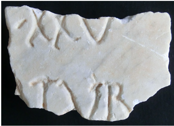
Fig. 4. Fragment de placa de marbre amb inscripció de la vil·la romana del Rajolar (Gandia).

que es trobava encastada en un mur de l'ajuntament i avui es conserva al MAGa (IRPV VI 212). Es tracta d'una ara dedicada a C. Pompeius Claudius que pot datar-se en el s. II d.C.