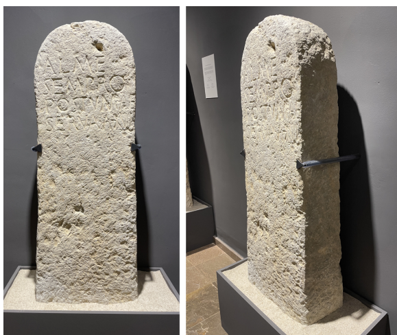
Fig. 2. Vista frontal (esquerra) i lateral (dreta) de l'estela de la vil·la romana de Pardines (Beniarjó).