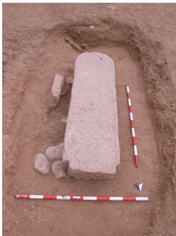
Fig. 1. Troballa de l'estela de la vil·la romana de Pardines (Beniarjó).

En el curs de les obres de laminació i control de revingudes a la conca mitjana del riu Serpis, l'any 2009 es va localitzar i excavar un complex terrisser d'època romana a la partida de Pardines (Moscardó 2007: 49 i 59; 2008: 188; Bernabeu et al. 2013). Tot i que estava molt arrasat, se'n van poder identificar diferents dependències. A la vora de les estances destinades a la manufactura i assecat de les peces ceràmiques, prèviament a la seua cuita, es va trobar una estela funerària. Estava en posició horitzontal en els nivells d'abandonament d'un dels àmbits identificats com a dependències artesanals (UE 1022) i coberta pel nivell d'amortització del centre terrisser i els forns (UE 1018) (fig. 1). La figlina estigué en activitat al llarg del s. I d.C., i es va abandonar a principis del s. II. Resulta estranya la presència de la inscripció a l'interior d'una de les habitacions del complex terrisser, si no es trobava colgada per davall del paviment.