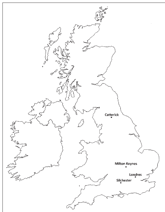
Fig. 1. Mapa con los sitios referenciados en el texto.

En esta obra no se hace alusión directa a su procedencia, simplemente al lugar donde se encuentra depositado. Esta pieza es una forma 33 con sello en el que se lee OF·SEMP (fig. 2, 3). El primero en advertir su posible relación hispana fue Garabito (1977: 157) quien, ante el